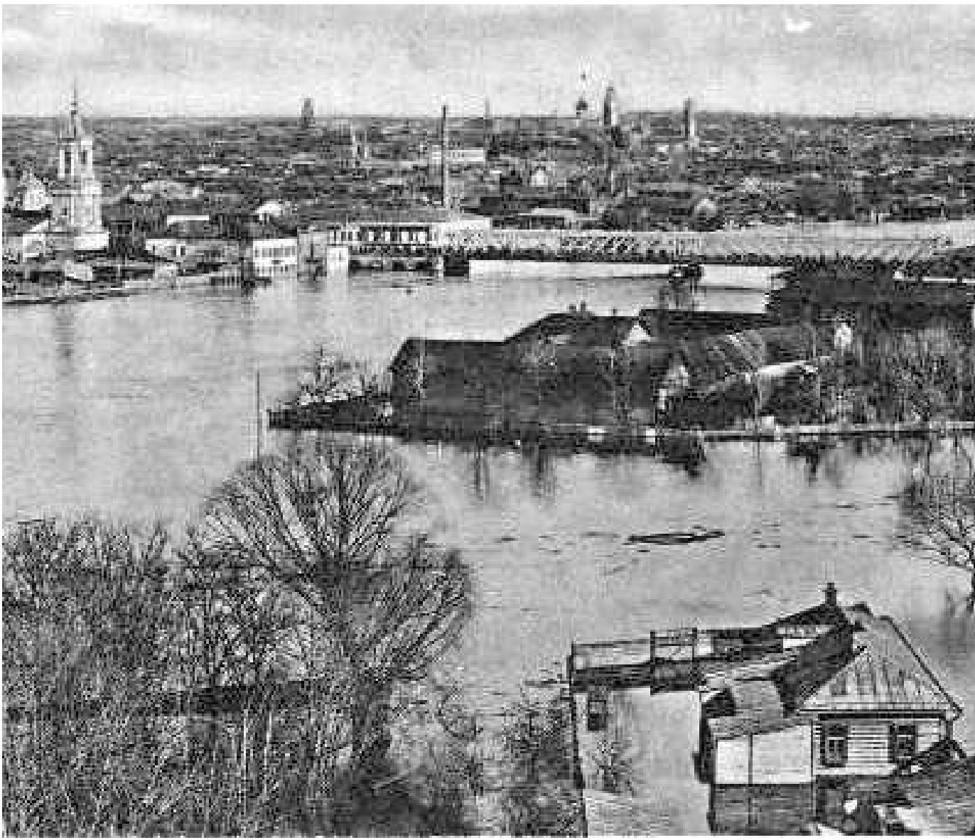
1908 год. Ока и Орлик во время разлива

Городской архитектор Орехов скоро рапортовал полицмейстеру, что обустроены «мосты на судах, поставленных в ряд», а вот Очный и Ор-