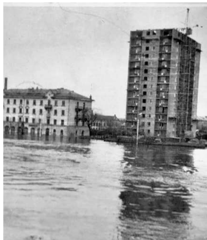
Паводок 1970 года

Узнать, где массово зимует рыба, которую нельзя тревожить, можно на портале Орловской области — www.orel-region.ru