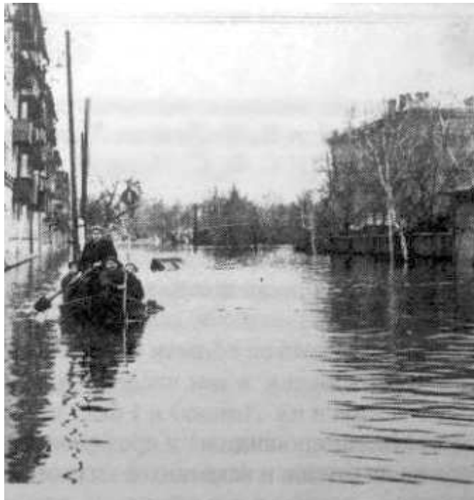
1970 год. Угол улиц Московская и Герцена

Зато дорожную бурёнку, растопырившую копы-