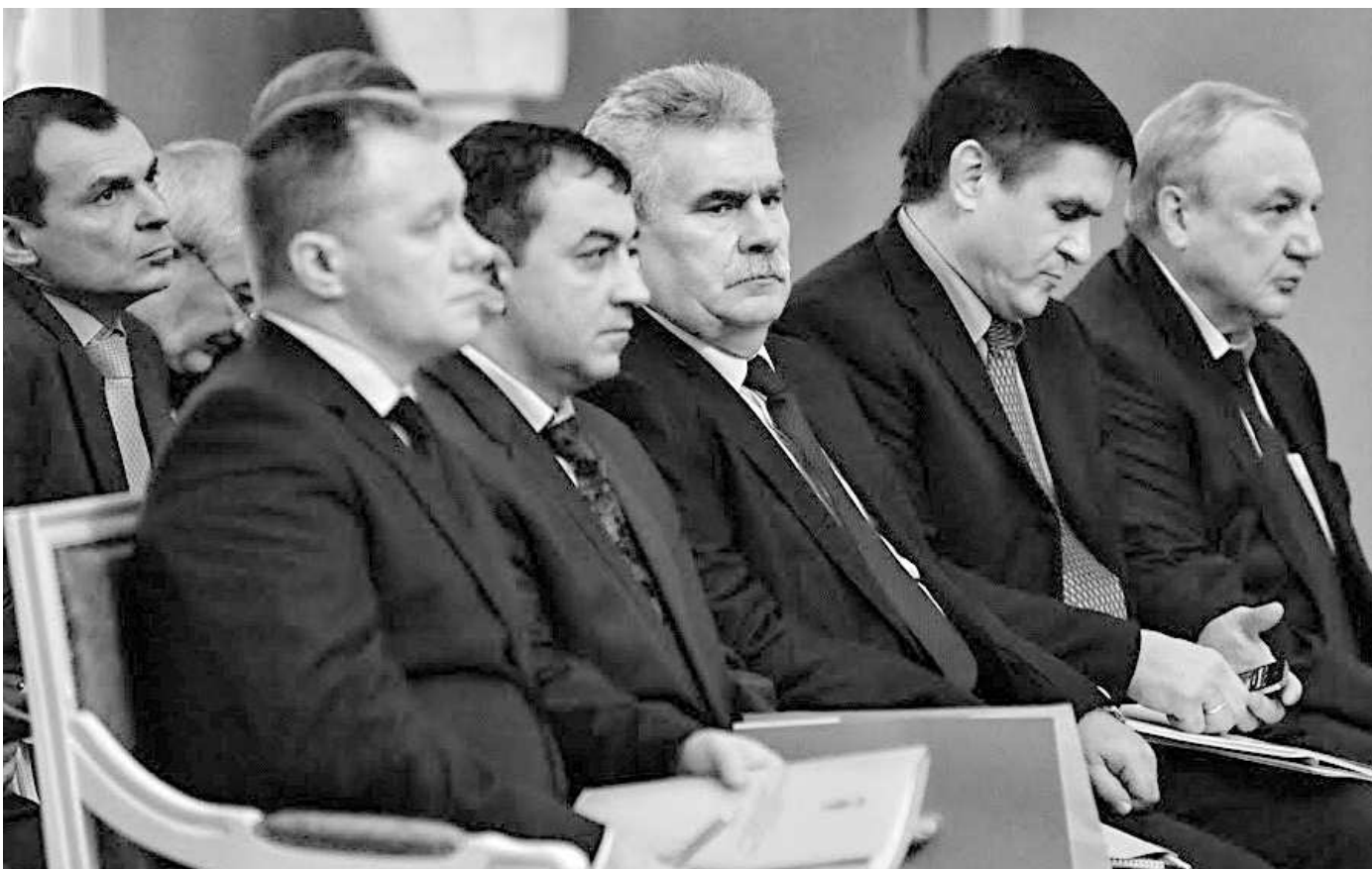
Окончание. Начало на 1-й стр.

Базовые ценности наших соотечественников стали предметом изучения многочисленных рейтинговых агентств и научных исследований. Вот данные, полученные в ходе опросов фондом «Общественное мнение». Самой активной, социально мобильной и в полном смысле современной частью населения являются 19% граждан. Личный путь к успеху и богатству в их сознании сочетается с готовностью к риску. При этом их деятельность нацелена не только на личное потребление и заботу о близ-