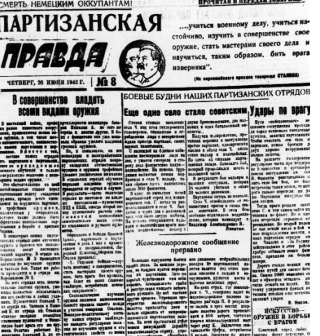
можно говорить очень много. Мы устремлены вперед и только вперед. Пусть трещат черные фашистские гады. За зверства, грабежи, поджоги и насилие над советскими людьми гитлеровцы отплатят своей кровью.

... О героических подвигах наших бойцов, командиров и политработников