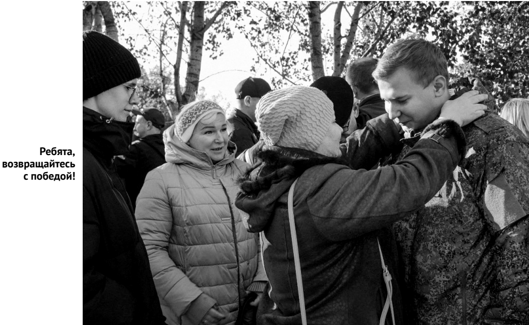
Ребята, возвращайтесь с победой!