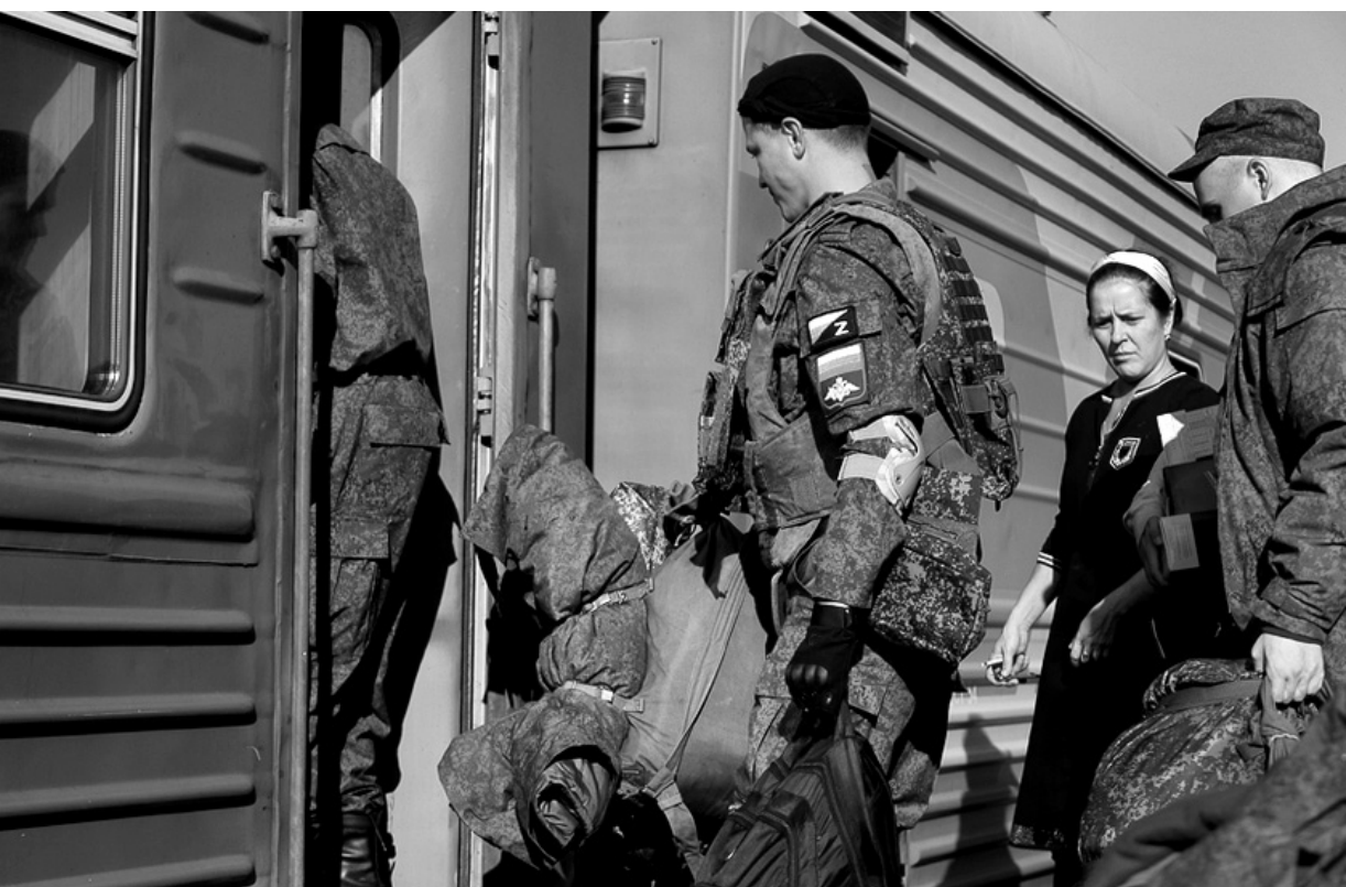
Участники спецоперации защищают нашу страну на передовой, и поддержать их — наша общая задача

Анализ обращений показывает, что большое число запросов касается порядка получения мер государствен-