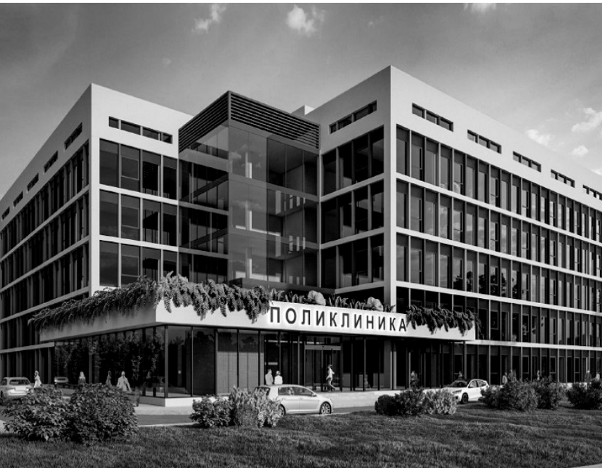
Такой видят новую поликлинику Железнодорожного района архитектуры