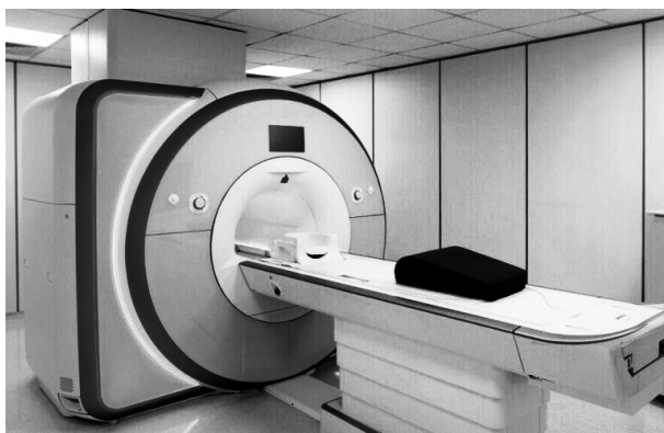
Фото mrt 24

Российские учёные презентовали первый отечественный аппарат МРТ высокой мощности.