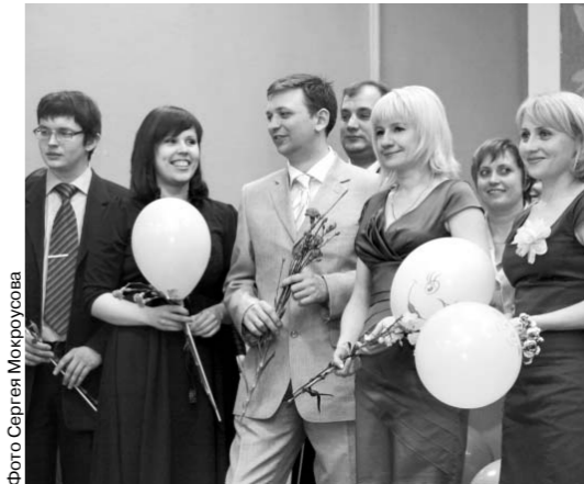
Жюри предстоит сложная работа, ведь здесь собрались лучшие учителя из лучших

● С символической клятвы педагогов началось торжественное открытие областного конкурса «Учитель года-2012», который состоялся в гимназии № 39 города Орла. Участники конкурса уже прошли первый тур. Впереди их ждут самопрезентация, открытая дискуссия, мастер-классы. Участникам надо убедить коллег, зрителей и членов жюри в том, что их проект, авторские разработки — это творческий, оригинальный и бесценный опыт, который могут воспользоваться другие педагоги.