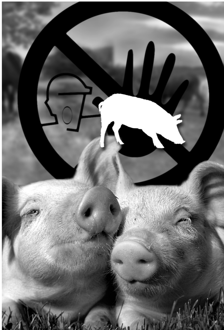
Чумной эффект ВТО

Возможно, для безопасности продукции подпольные бойни как раз надо легализовать. А предпринимателей заставить сделать спецплощадки и контролировать убой, как того требует ветзаконодательство, а не запрещать им работать. Пусть будет хотя бы как в Украине: крестьянин сам выращивает и легально бьет скот, включая поросят, на своем подворье. Тогда домашней свининки мы не лишимся.