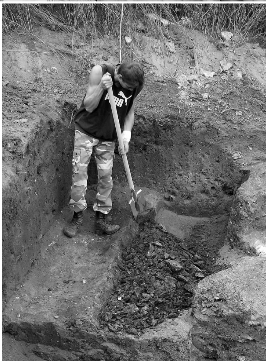
Трудно поверить, но здесь когда-то стоял дом