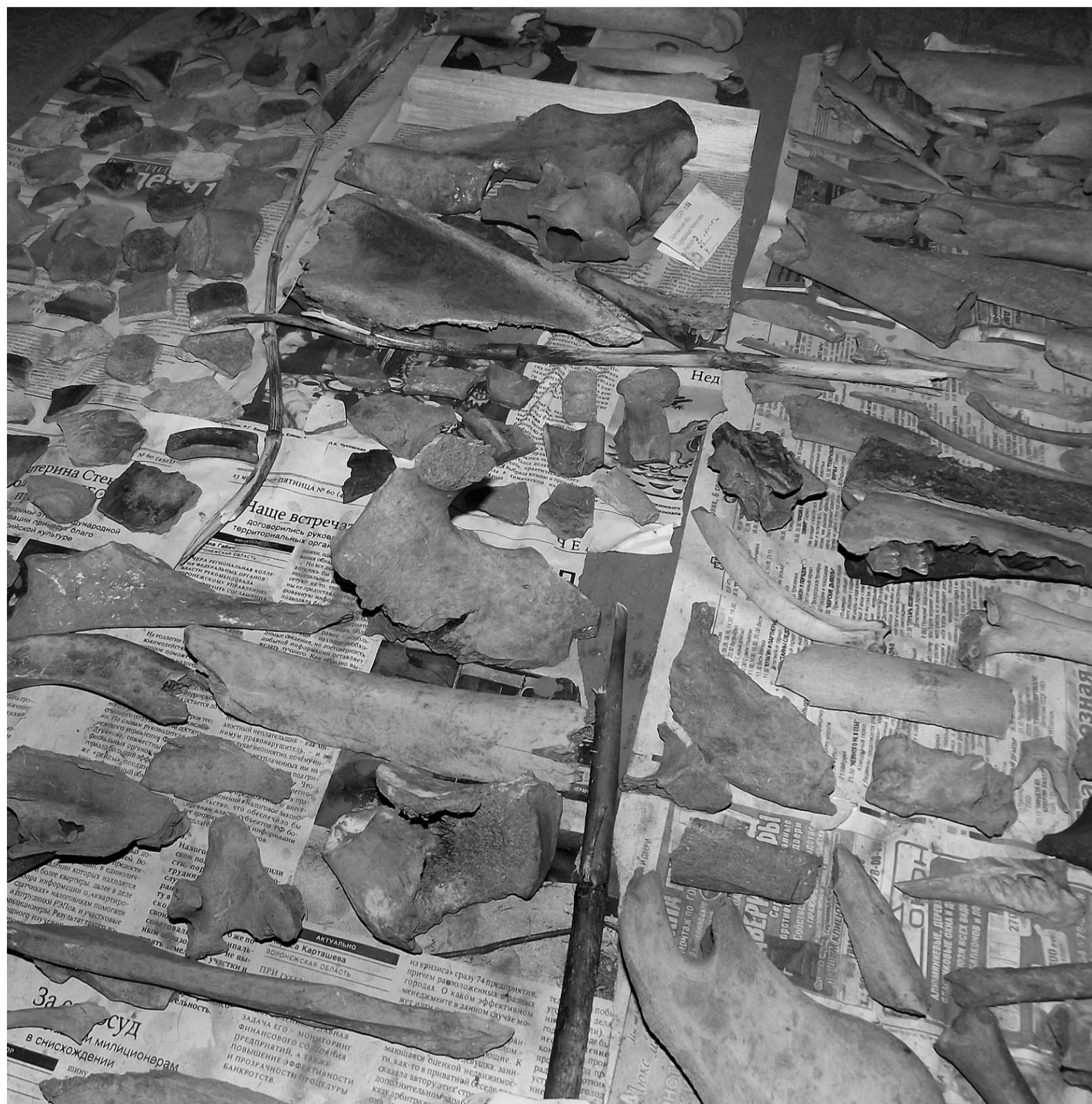
Чаще всего находками становятся кости животных и остатки глиняной посуды

В этом году раскопки ведутся там, где стоял какой-то дом. Сейчас они раскапывают подклетку — нижнюю часть строения. По найденной здесь в 2008 году шпоре его кто-то окрестил домом кавалериста, что неправильно. Сказать точно, кто был его обитателем, сложно. Возможно, какой-то горожанин, не связанный с производством това-