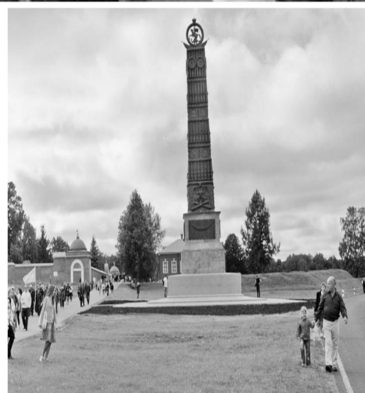
Монумент «Благодарная Россия — своим защитникам» у стен Спасо-Бородинского монастыря. Разрушен в 30-е годы. Восстановлен в 1995 году

...Эта атака на батарею Раевского стоила французам очень дорого. Неприятель потерял до 3 000 человек убитыми и ранеными, среди них пять генералов. Тяжелые потери понесли и русские. Контратака Ермолова произвела сильное впечатление на французов.