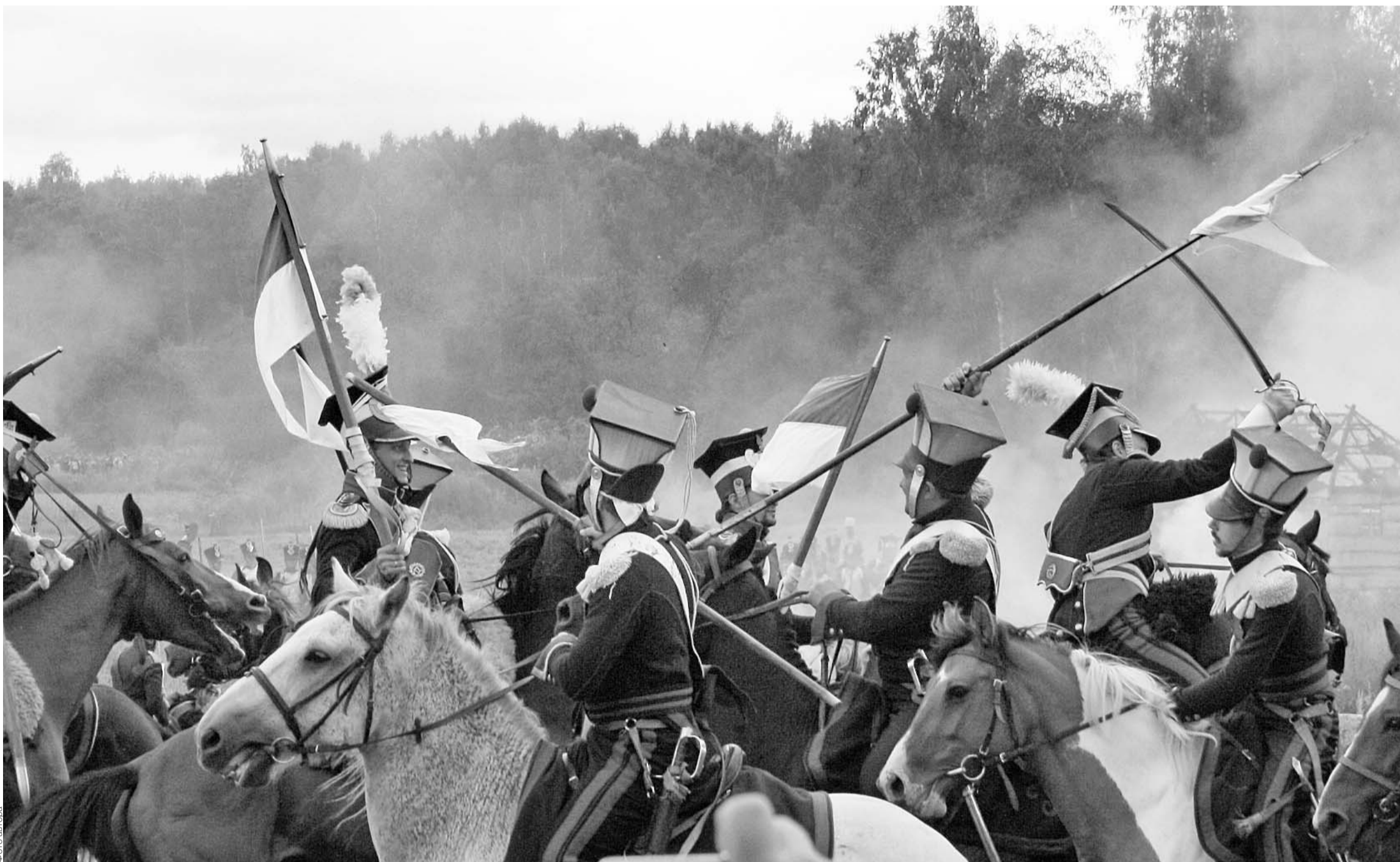
В состав орловской делегации входили шестидесять участников. Это учащиеся и преподаватели Протасовской средней школы Мценского района, представители орловского казачества, члены поискового отряда «Факел» и трех военно-исторических клубов — «Орел», «Орловский рубеж», «Орловская пехота». Поездка организована департаментом образования, культуры и спорта Орловской области.

«Яростная» кавалерийская схватка. В целях безопасности обошлось без звона сабель и падения с лошадей