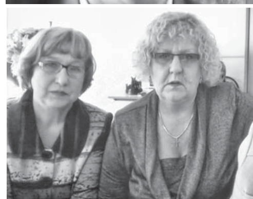
Педагоги ресурсного центра дистанционного образования детей-инвалидов: — В режиме интерактивного общения дети с учителями могут находить намного больше времени, чем в рамках обычного урока

гим школьникам, которые начинают дистанционное обучение. Но ведь после окончания школы большинство детей продолжит образование, и это оборудование по-прежнему будет им необходимо.