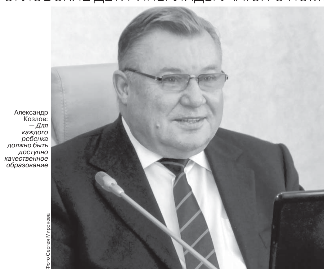
Александр Козлов: — Для каждого ребенка должно быть доступно качественное образование