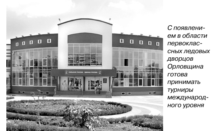
С появлением в области первоклассных ледовых дворцов Орловщина готова принимать турниры международного уровня

22 августа во Мценске в Ледовом дворце начинается первый международный турнир по хоккею среди юниоров — «Кубок Госуниверситета-УНПК».