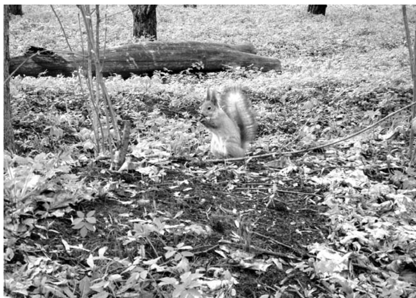
Фото Димы К., г. Орел.

Наш адрес: 302000, г. Орел, ул. Брестская, 6, к. 33.