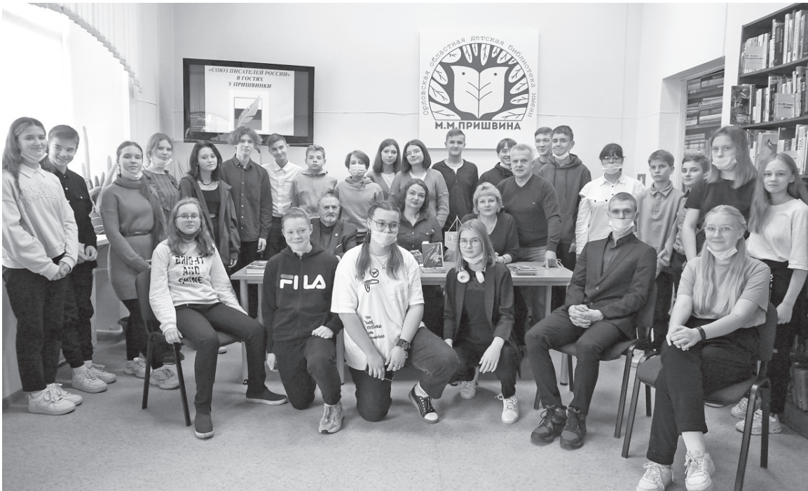
Встреча в библиотеке стала для школьников уроком литературы