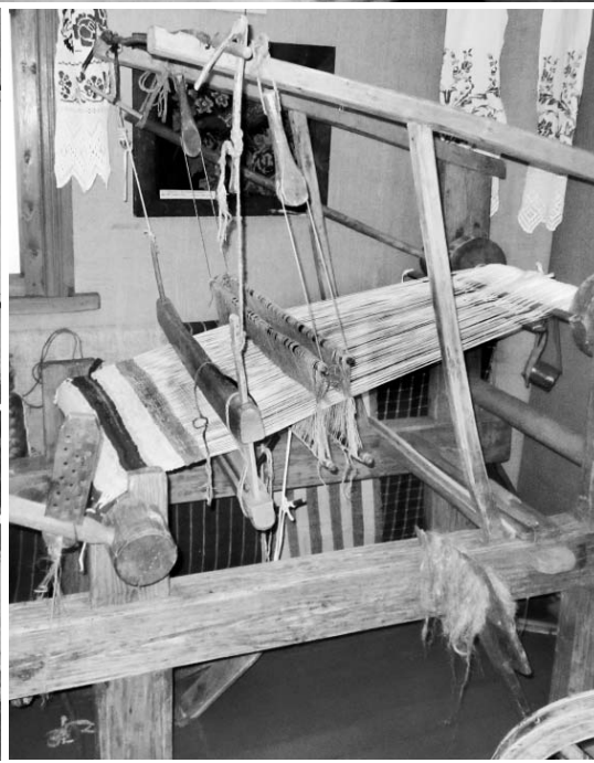
Ткацкие станы в ильинском музее до сих пор в рабочем состоянии