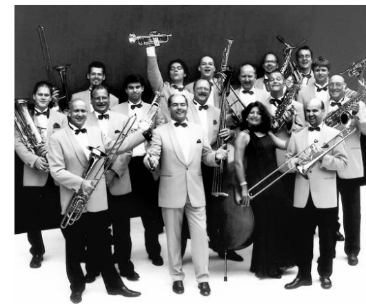
Оркестр Гленна Миллера приедет в Орел в полном составе

В программе оркестра помимо произведений Гленна Миллера также композиции из репертуаров Луи Армстронга, Фрэнка Синатры, Элвиса Пресли, Эллы Фицджеральд. В программе инструментальные композиции сочетаются с мужскими и женскими вокальными партиями. Непременно в каждом концерте звучит знаменитая «Серенада солнечной долины» — визитная карточка оркестра Гленна Миллера.