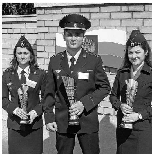
Победители конкурса — надёжный резерв страны