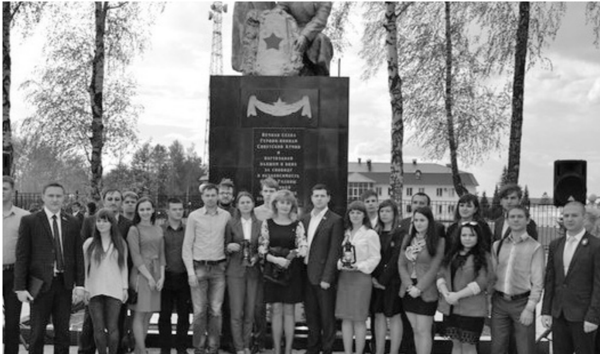
Акция «Огонь Победы» сплотила молодёжь Орла, Калуги и Тулы

— Из истории известно, что Югославия продержалась против фашистов всего 11 дней, Польша — 27, Франция — чуть больше месяца.