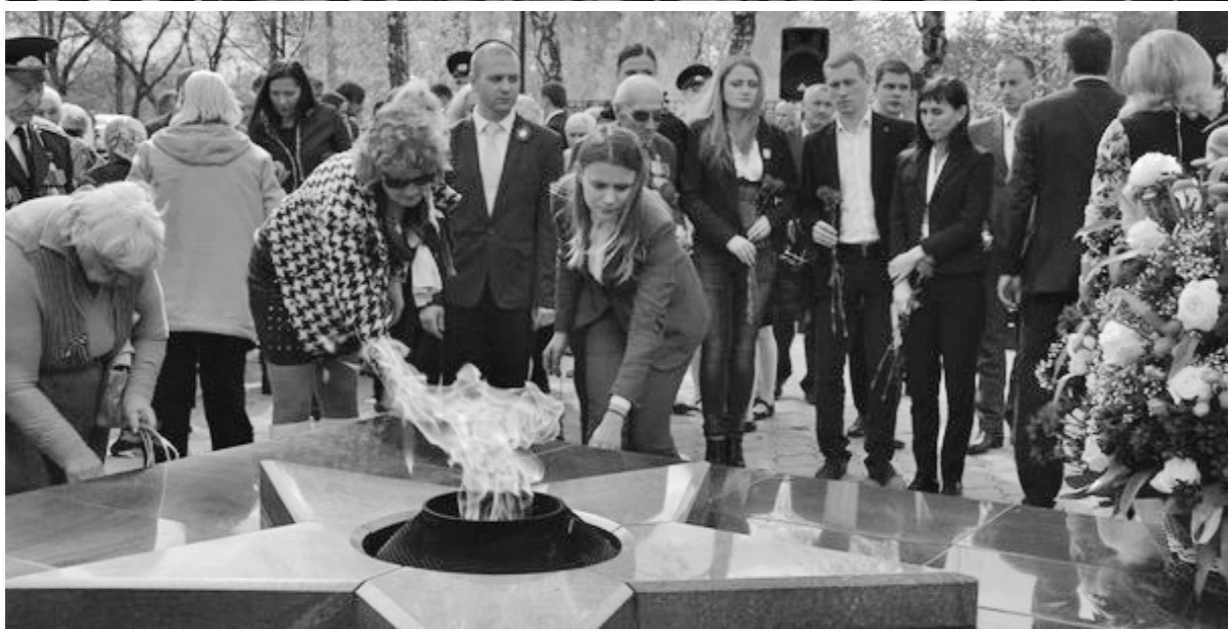
Из Тулы частицы Победы привезли в Орёл

«Сегодня памятники, обелиски и Вечные огни напоминают нам о той страшной цене, которую заплатил наш народ за Великую Победу.»