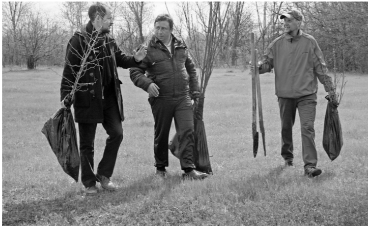
Журналисты из Орла тоже поработали лопатами