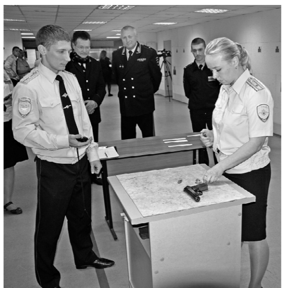
Девушки-полицейские с оружием на «ты»