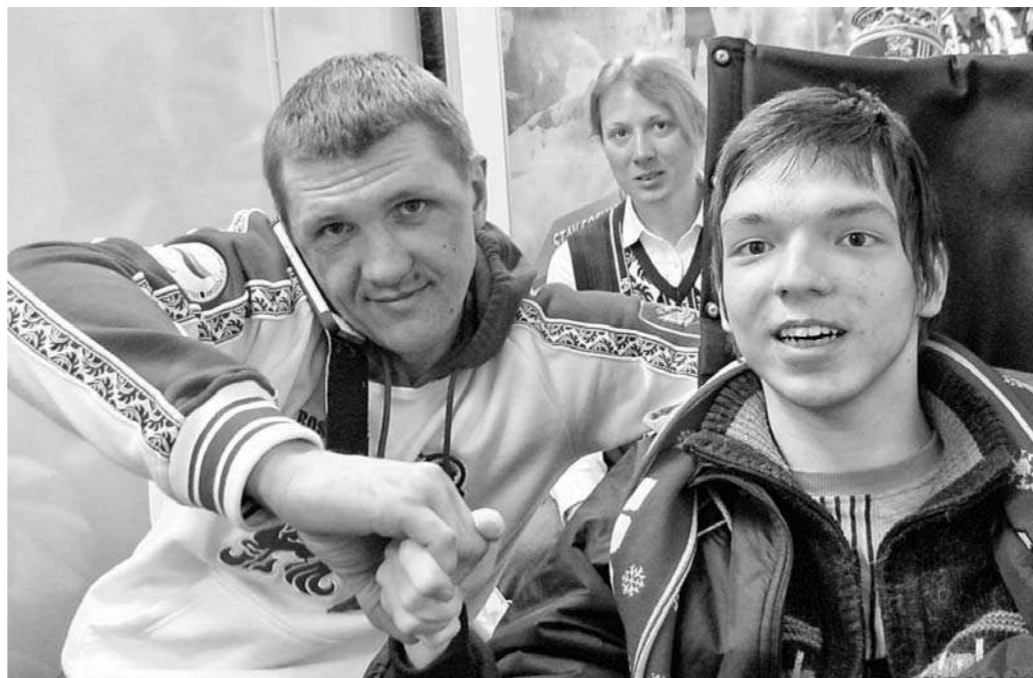
С шестикратным чемпионом Романом Петушковым

— Уставал страшно, ныло бедно после операции, но всё-таки не жалею, что согласился на такую авантюру, — делится со мной Астамир. — На репетициях нас гоняли, не давая никаких скидок. Если нужно было на колясках выстроиться в ровную линию, то проделывали это по несколько раз, пока не получилось идеально точно. Если надо развернуться, чтобы получить какой-то рисунок, то тренировались до тех пор, пока все