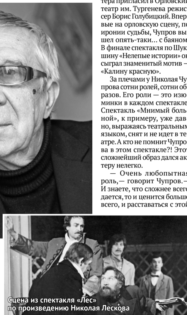
Сцена из спектакля «Лес» по произведению Николая Лескова