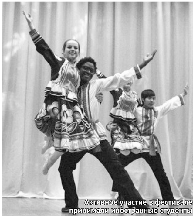
Активное участие в фестивале принимали иностранные студенты