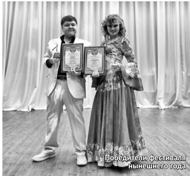
Победители фестиваля нынешнего года