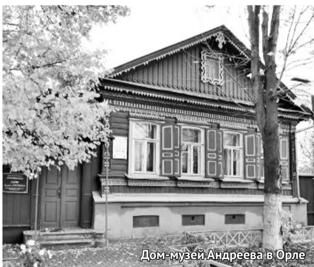
Дом-музей Андреева в Орле