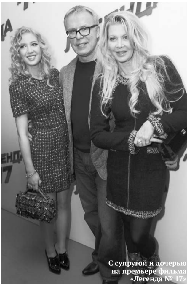
С супругой и дочерью на премьере фильма «Легенда № 17»

— Мы с моим бывшим партнером по ЦСКА и сборной Лешей Касатоновым однажды решили покататься на Планерной. Сели на лошадей, так у них чуть ноги не разъехались. У меня есть