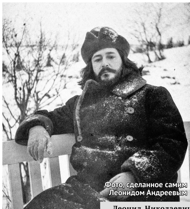
Фото, сделанное самим Леонидом Андреевым

Несколько раз Леонид Николаевич пытался по-