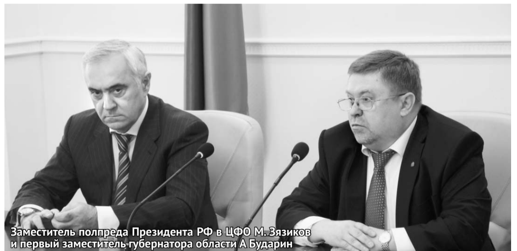
Заместитель полпреда Президента РФ в ЦФО М. Зязиков и первый заместитель губернатора области А. Бударин

С начала 2014 года в общественные приемные региона обратились 6 204 гражданина. Это примерно на 1,5 тысячи больше, чем за аналогичный период прошлого года. Почти полторы тысячи обращений поступило в общественную интернет-приемную. Также было принято около 4,5 тысячи телефонных звонков. Примерно треть обращений граждан касается вопросов социального характера: проблем в сфере здравоохранения, лекарственного и