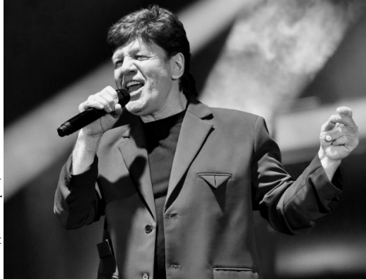
Спеть вместе с заслуженным артистом России Феликсом Царикати пришли около 15 тыс. орловцев