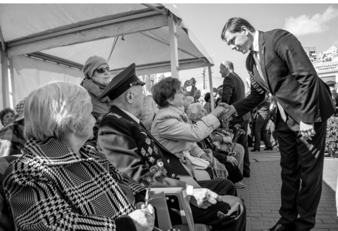
Спасибо за Победу!