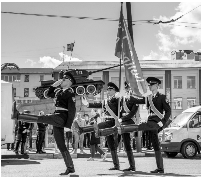
Через несколько мгновений над Орлом взвьётся победное знамя