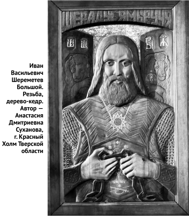
Иван Васильевич Шереметев Большой. Резба, дерево-кедр. Автор — Анастасия Дмитриевна Суханова, г. Красный Холм Тверской области