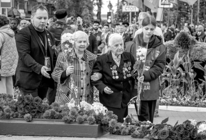
Память о бессмертном подвиге народа объединяет поколения