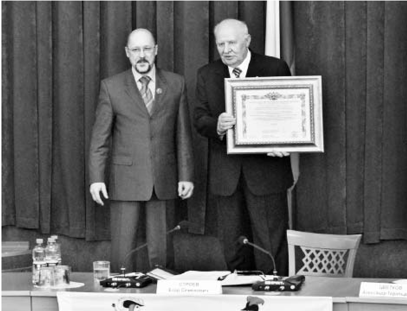
Момент вручения свидетельства о государственной регистрации официальных символов Орловской области.

Губернатор провел историческую параллель между трагическими событиями Великой Отечественной войны и агрессией Грузии против югоосетинского народа. Е.С. Строев особо подчеркнул важность единства российского народа в оценке происшедших событий, а также единую поддержку действий руководства государства по защите граждан России,