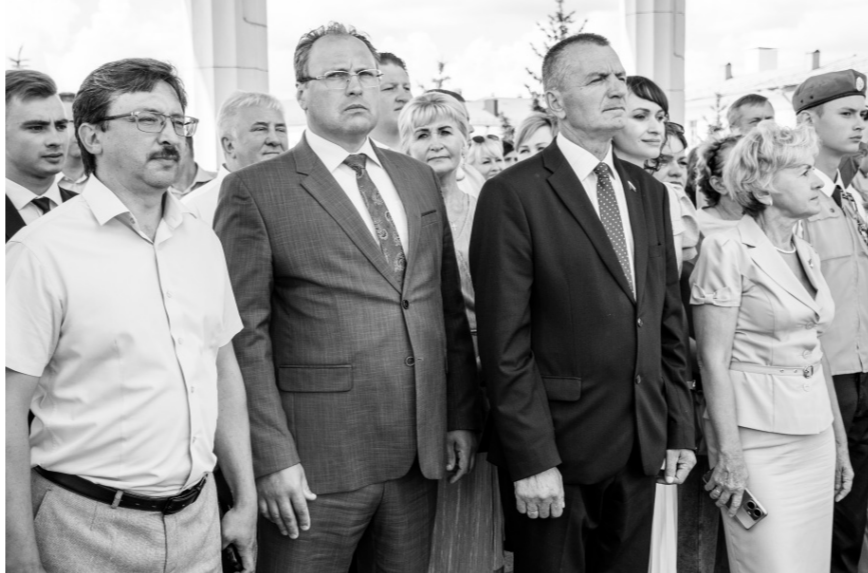
В Орле торжественно встретили поезд