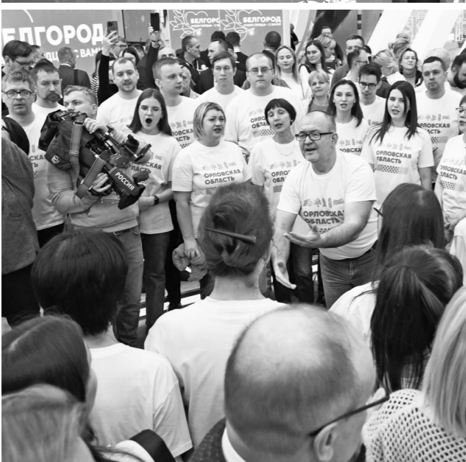
Специально к выставке был разработан уникальный бренд-бук и изготовлено 29 видов сувенирной продукции. Фирменными элементами стали знаменитый орловский список и изображение европейского зубра, обитающего в национальном парке «Орловское Полесье».