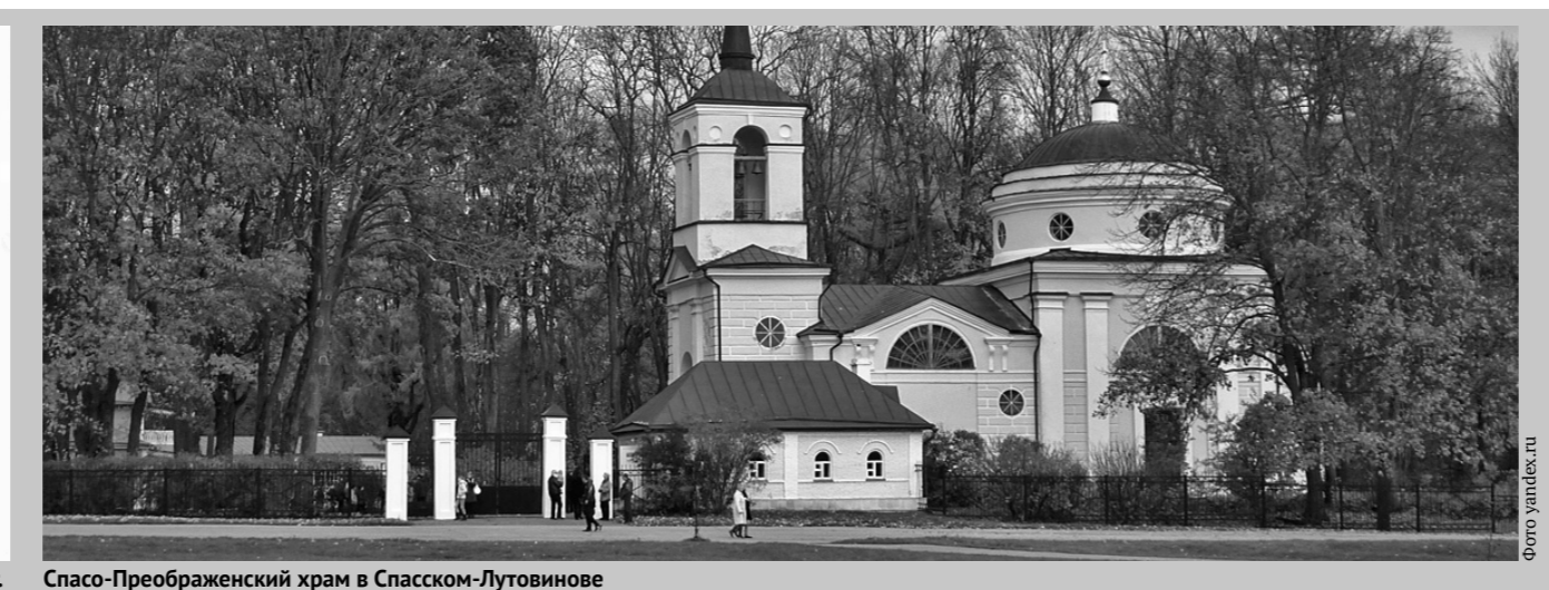
Спасо-Преображенский храм в Спасском-Лутовино