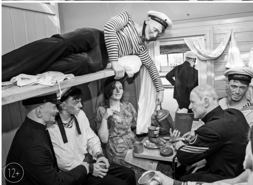
Ни в одном музее мира нет такого количества многофигурных композиций в скульптуре