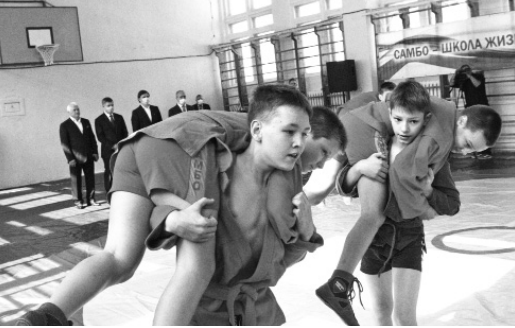
Юные спортсмены показали почётным гостям несколько приёмов самбо