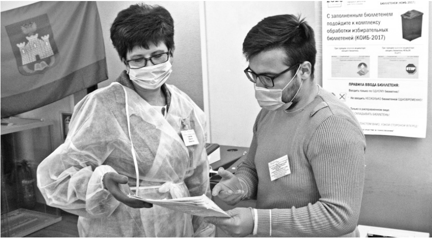
Голосование — отлаженный процесс

Голосование набирает обороты, но примерно в девять часов