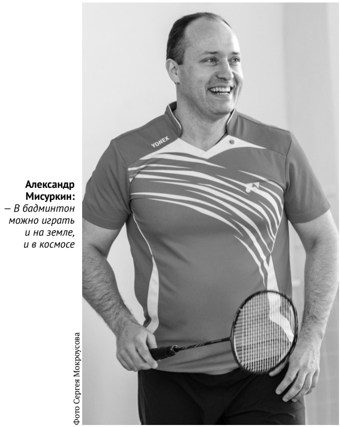
Александр Мисуркин: — В бадминтон можно играть и на земле, и в космосе