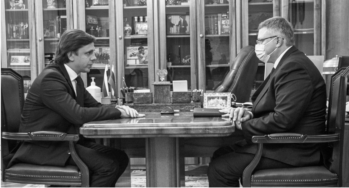
О детских проблемах — по-взрослому