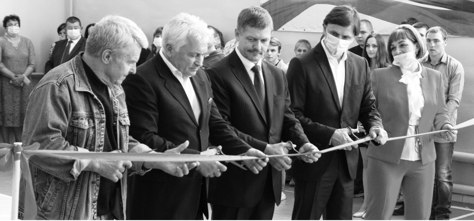
Торжественное открытие спортзала для занятий самбо в пос. Стрелецком

За поддержку в развитии самбо, сохранение и продолжение национальных спор-