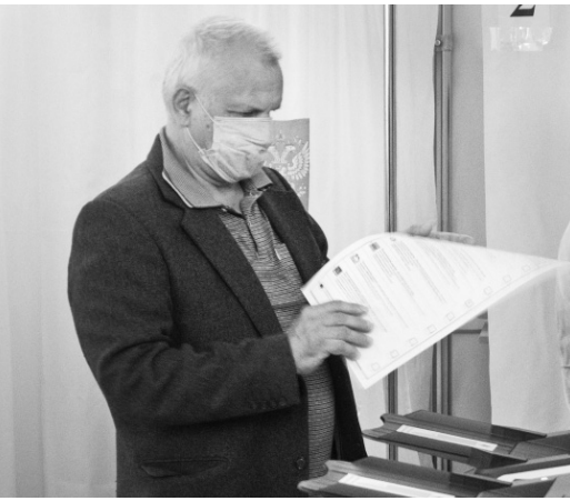
Пять минут, потраченные на голосование, определяют будущее Орла на несколько лет

— Никаких нарушений. Внимательнее. Наблюдатели должны всё видеть, — умело координирует работу председатель УИК.