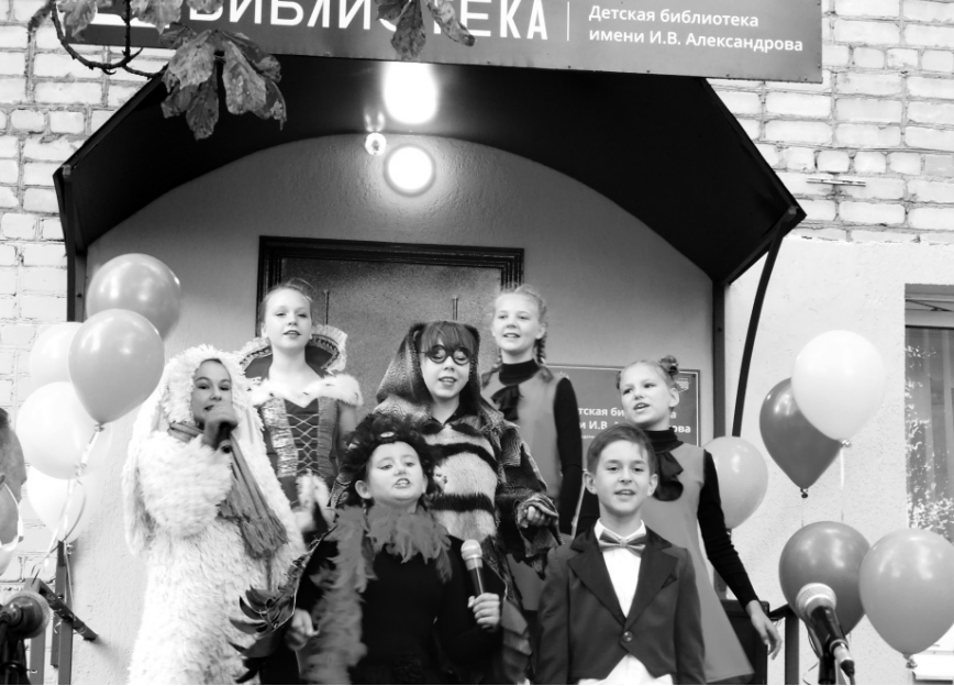
Открытие новой библиотеки стало праздником для детей

Осуществлена полная «перезагрузка» библиотеки. Теперь она соответствует требованиям самого придирчивого современного читателя. Идея «открытой библиотеки» будет реализовываться на основе интерактивных форм взаимодействия и творчества. Начнут функционировать медиастудия «Драйв», краеведческий клуб «Искатели», кружок финансово-правовой грамотности «Гражданин», клуб