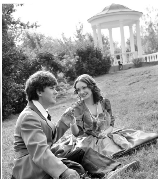
Студенты Орловского колледжа культуры и искусств прекрасно вжились в тургеневские образы