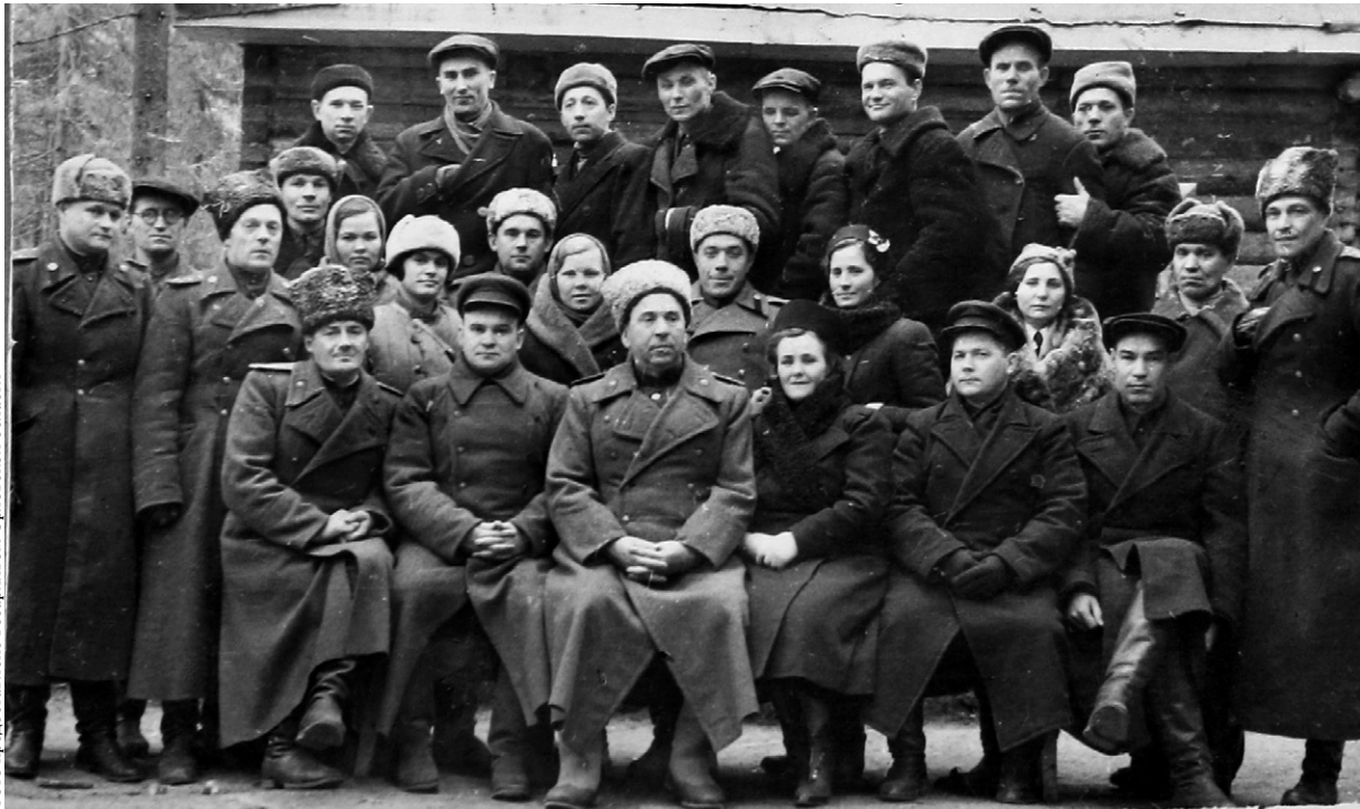
Г. С. Родин среди делегатов областей Урала перед отправкой на фронт. 1943 г.

Рано утром 7 ноября батальон занял исходную позицию для участия в параде на Красной площади в Москве. После парада Родину передала благодарность народного комиссара обороны СССР и пригласили в Кремль на приём. В июне Георгию Семёновичу было присвоено звание полковника.