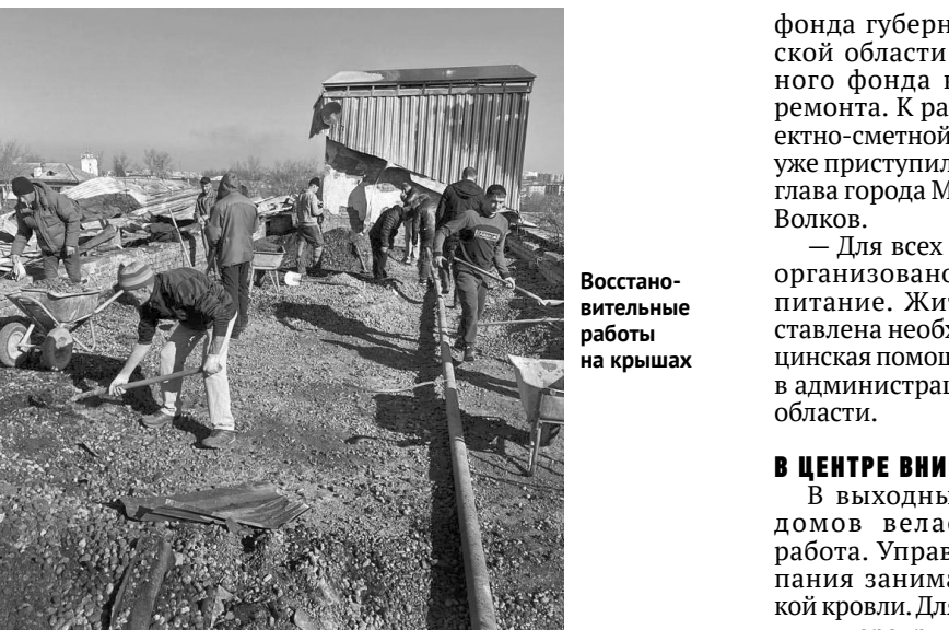
Восстановительные работы на крышах

а также в общежитии Мценского филиала ОГУ им. И. С. Тургенева.