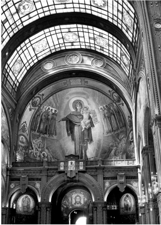
Икона Пресвятой Богородицы с младенцем на руках