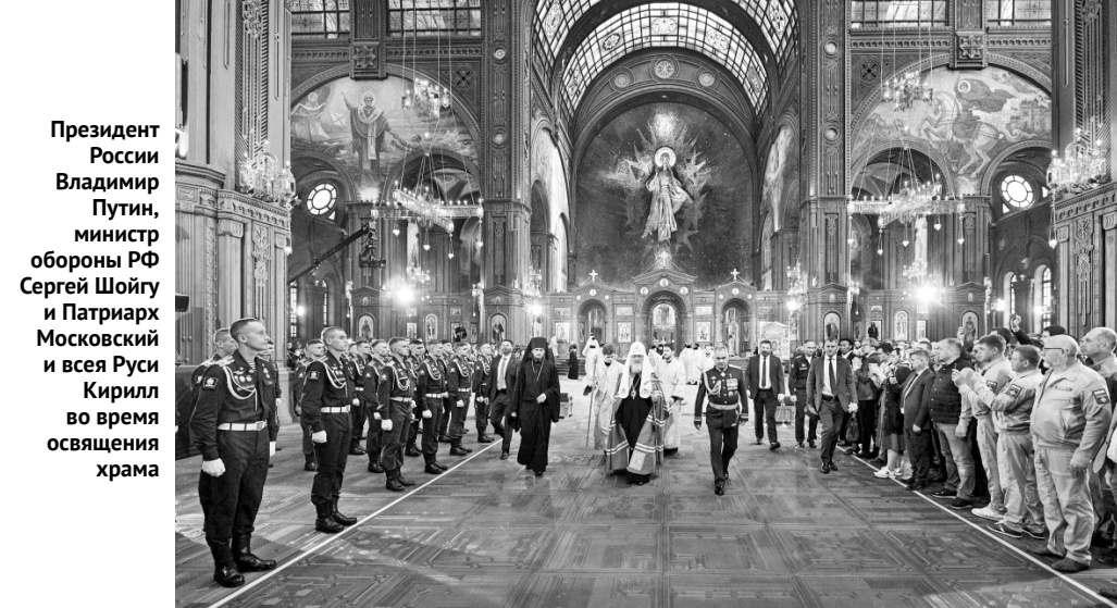
Президент России Владимир Путин, министр обороны РФ Сергей Шойгу и Патриарх Московский и всея Руси Кирилл во время освящения храма

кая деталь: дверную ручку на главных воротах сделали в форме богатырского меча, на котором вырезано знаменитое изречение Александра Невского: «Кто с мечом к нам придёт, от меча и погибнет!» Каждый, кто трогает рукой этот меч, непременно прочтёт надпись.