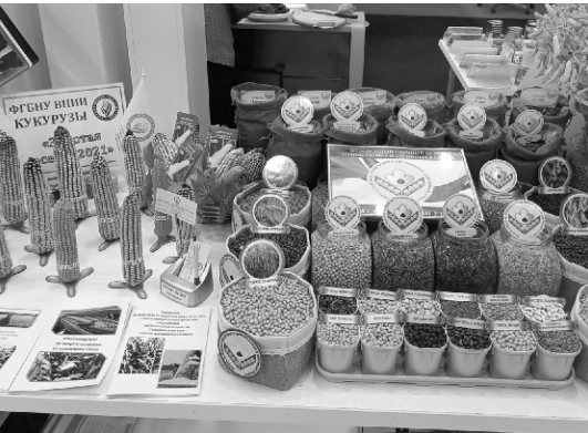
Продукция ФНЦ ЗБК хорошо известна сельхозпроизводителям России

сельхозпредприятий, специалисты отрасли, представители аграрной науки, фермеры.