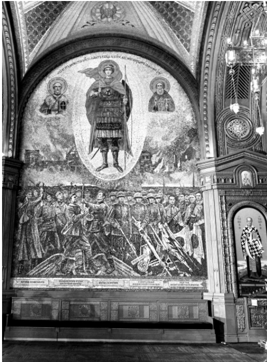
Мозаика. Фрагменты военной истории с текстами из Священного Писания