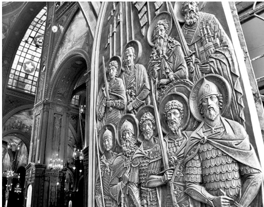
Барельефное изображение русских воинов

Кирилл, Патриарх Московский и всея Руси: — На алтарь Победы были отданы тысячи и тысячи жизней, и, празднуя Победу, мы никогда не должны забывать о жертвах и о подвиге нашего народа. Это священные жертвы, это величайший подвиг за всю тысячелетнюю историю России.