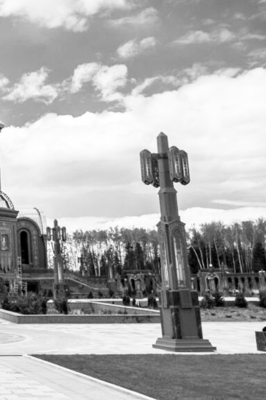
Этот храм соединил в себе земное и божественное, великий дух и великий подвиг народа и его ратных дружин