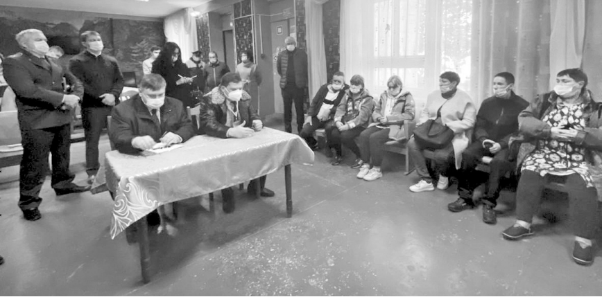
Руководство Орловской области встретилось с жителями пострадавших домов

Пострадавших от огня жителей разместили в общежитии Орловского техникума агробизнеса и сервиса,