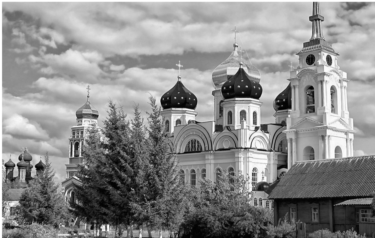
Уж чего-чего, а храмов в Болхове в избытке. Даже в те времена, когда каждый город изобилует церквями, Болхов выделялся: к концу XIX в. здесь было около 30 храмов

Туроператоры отмечают, что в последнее время вырос спрос на внутренний туризм. У орловцев особый интерес к турам в Санкт-Петербург, Карелию и по «Золотому кольцу» России.