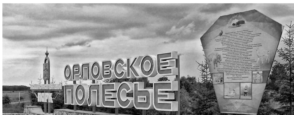
Национальный парк «Орловское Полесье» давно стал настоящим символом области.

103 турагентства и 8 туроператоров работают в туристской отрасли Орловской области