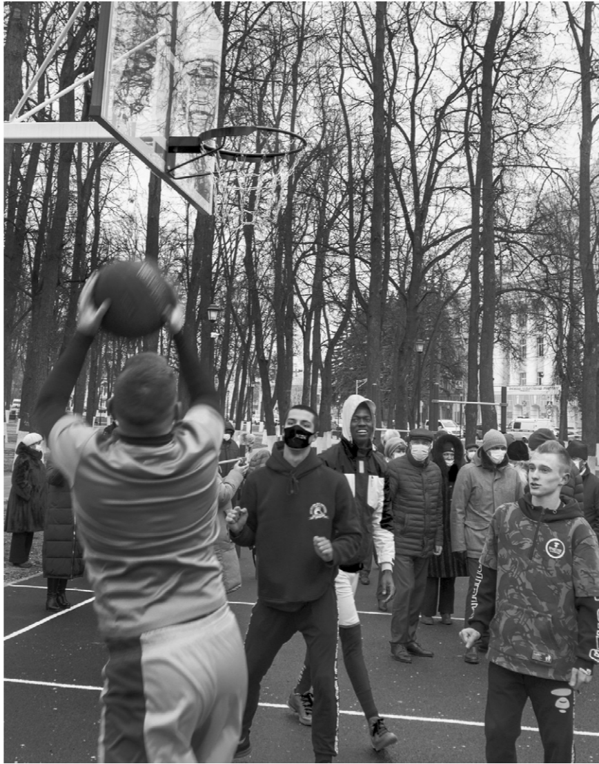
Студенты ОГУ им. И. С. Тургенева быстро облюбовали новую баскетбольную площадку