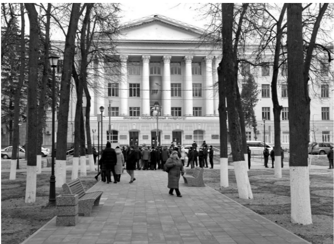
Обновлённый сквер Комсомольцев станет украшением не только ведущего вуза региона, но и всего города

Без сомнения, этот уютный и красивый уголок теперь станет излюбленным местом отдыха орловцев. Здесь они смогут погулять, позаниматься спортом и даже зарядить телефон.