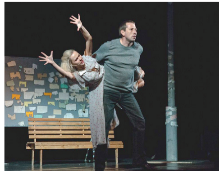
«С любимыми не расставайтесь!»