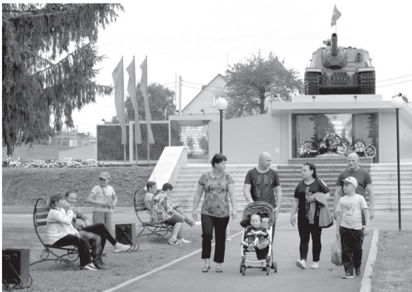
На мемориале воинской славы

— Активная и результативная работа ведётся и по двум другим — «Образова-