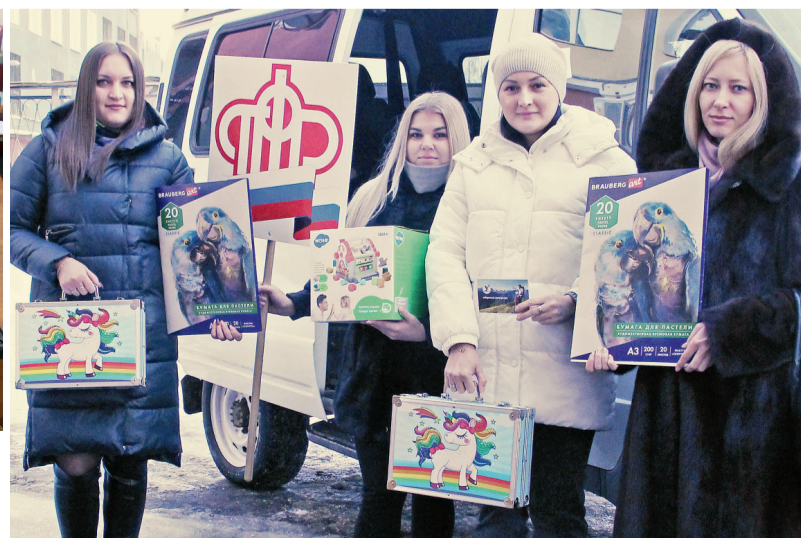
Сотрудники реготделения ПФР в роли добрых волшебников