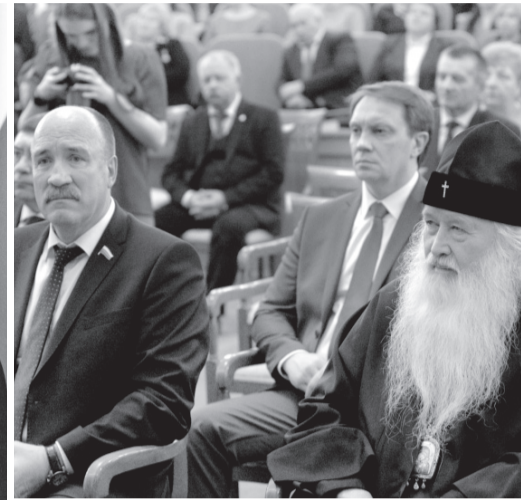
На торжественной церемонии вручения наград

Губернатор поздравил всех награждённых с высокой оценкой их трудо-