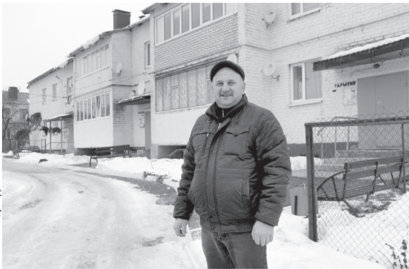
Благоустроенный двор на улице Ленина, 17

ние» и «Культура» в рамках региональных проектов. В сфере образования таких региональных проектов целых три: «Успех каждого ребёнка», «Современная школа» и «Цифровая образовательная среда». В рамках проекта «Успех каждого ребёнка» отремонтировано пять спортивных залов, открыто 24 дополнительных места для занятий физкультурой. В сентябре в Сосковскую среднюю общеобразовательную школу доставлено и установлено оборудование на 97 тыс.