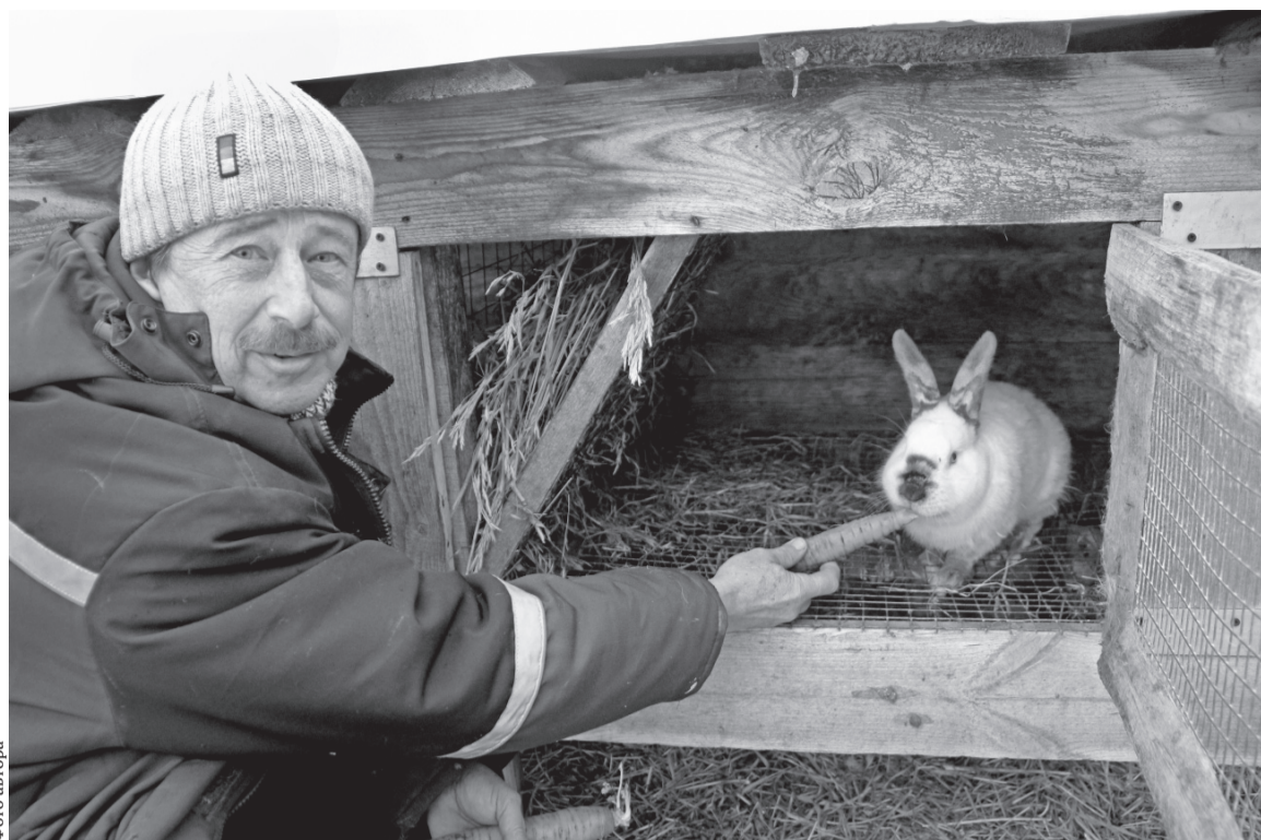
На Новый год кролики Гагариных получат побольше своего любимого лакомства — морковки