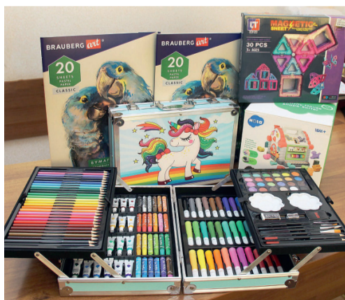
Наборы для творчества и игрушки