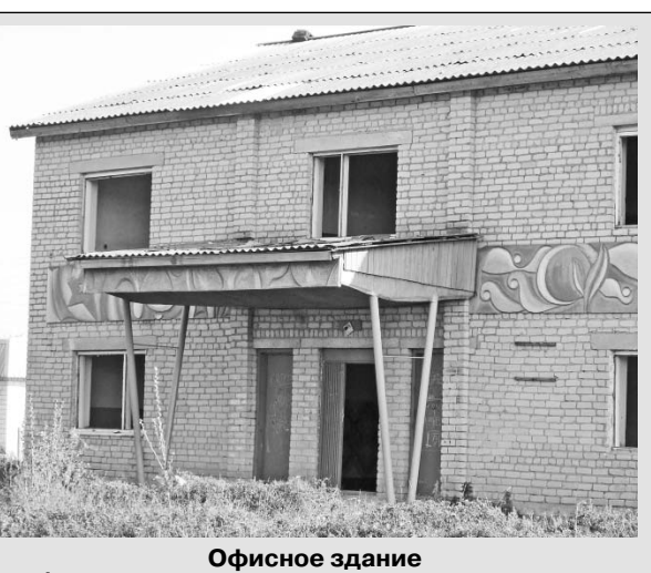
Офисное здание бывшего совхоза Нижне-Залегощенский.

К 1998 году на комплексе оставалось заполненным скотом лишь одно помещение. Но, как известно, в 1999 году в области начался очередной этап аграрной реформы, подразумевавшей создание районных агрофирм, так сказать, «процесс концентрации собственности у юридических лиц». Собственность «Нижне-Залегощенского» сконцентрировалась в рамках единственного на то время агрохолдинга — ОАО «Орловская Нива». Надо сказать, что, несмотря на ошеломительную разницу 90-х годов, собственности в бывшем совхозе «Нижне-Залегощенский» (к тому времени переименованном в ОАО «Восход») оставалось еще, на удивление, мно-