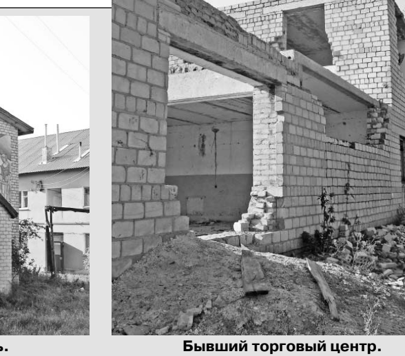
Бывший торговый центр.

го. Об этом легко узнать из старой, десятилетней давности, подшивки «Орловской правды»: регулярные репортажи вашей покорной слуги (в то время редактора отдела сельской жизни) о создании районных агрофирм составят исчерпывающую летопись орловской интеграции. Вот цитата из статьи «Агрофирма принимает друзей» (март 1999 года): «В эти дни районная агрофирма «Залегощь-Нива» отменяет полуголовую веку... В настоящее время в нее входят ООО «Восход» (бывший совхоз «Нижне-Залегощенский») с комплексом по откорму КРС, мехмастерской, мехтоком и торговым центром» (напомним читателю, что речь идет о том самом торговом центре, развалины которого мы живописали в начале этой статьи). Торговый центр в с. Казарь также является структурным подразделением ОАО «Залегощь-Нива» — как необходимое звено в осуществлении замкнутого цикла «поле(ферма) — переработка — прилавок», основной экономической идеи интегрированных образований в рынке».