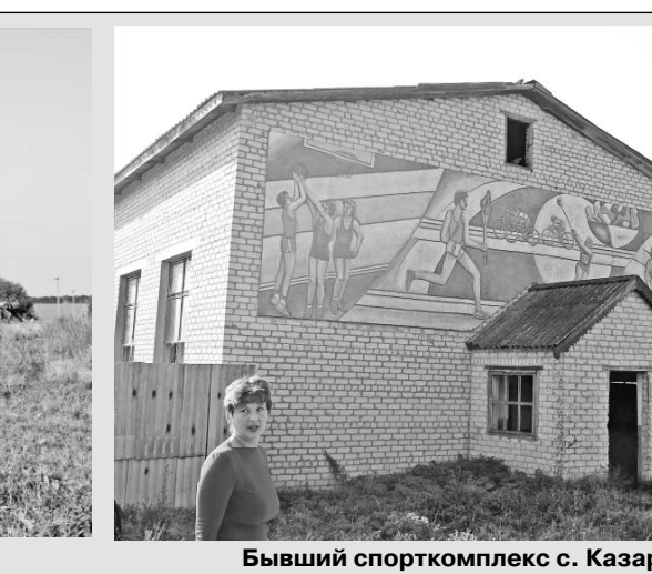
Бывший спорткомплекс с. Казарь.