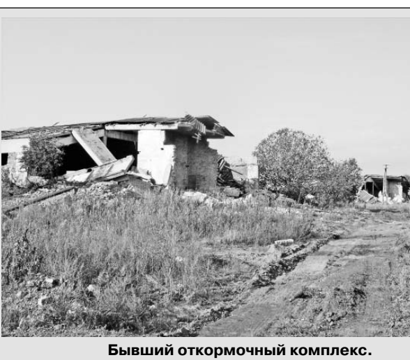
Бывший откормочный комплекс.