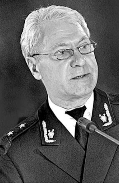
Сильная власть в современном мире сильна только в гражданском обществе.

Сильная власть в современном мире сильна только в гражданском обществе. И потому задача власти — всемерное содействие его формированию.