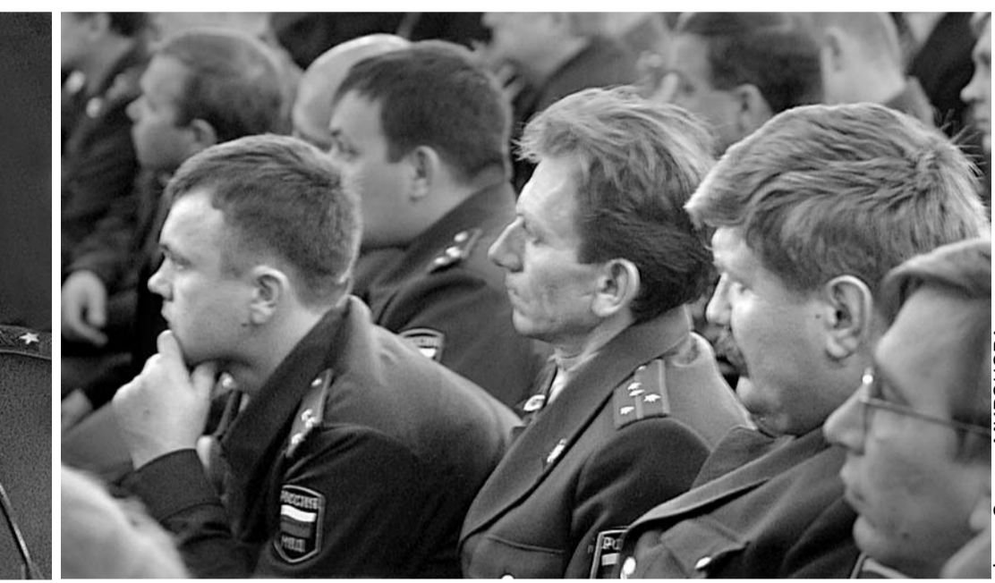
Сильная власть в современном мире сильна только в гражданском обществе.

шам: даем газ, восстанавливаем храмы, строим больницы, школы, улицы асфальтируем, все даем. Но не можем же мы все делать за местного властью, работать вместо участкового милиционера!