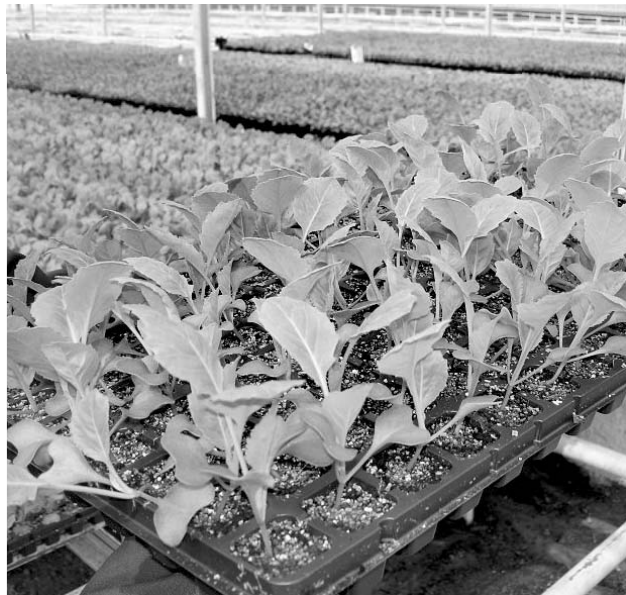
сорта и гибриды капусты по срокам посева делятся на группы:

Рассаду капусты всех видов можно выращивать и дома: на подоконнике, между рамами окна, на балконе, веранде; и в парнике — теплом или холодном; в рассаднике, устроенном на грядке или на столбиках, и, конечно же, в теплице. Раннюю капусту можно вообще выращивать безрассадным способом, высевая семена прямо на гряды. Вегетационный период при таком способе выращивания сокращается. Для того чтобы вырастить качественную рассаду, огороднику надо знать, какой сорт белокочанной капусты (по длине вегетационного периода) он покупает, потому что от этого зависит возраст рассады и время высадки ее в грунт, а также то, для каких целей она предназначена: для летне-осеннего потребления, для квашения, для зимнего хранения. Все