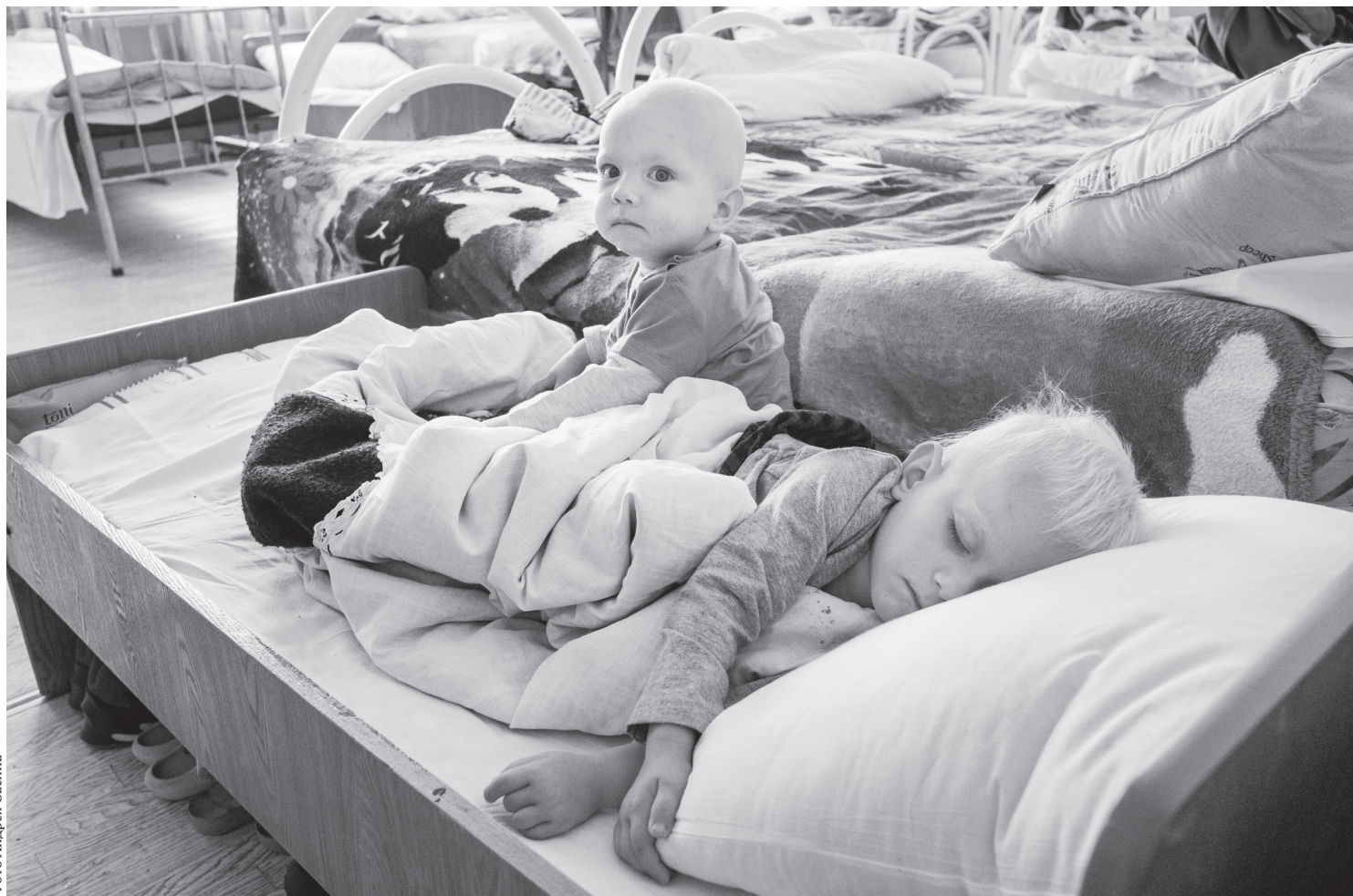
Дети в безопасности

Не все нашли в себе силы пообщаться с журналистами «Орловской правды» после перенесённого стресса.