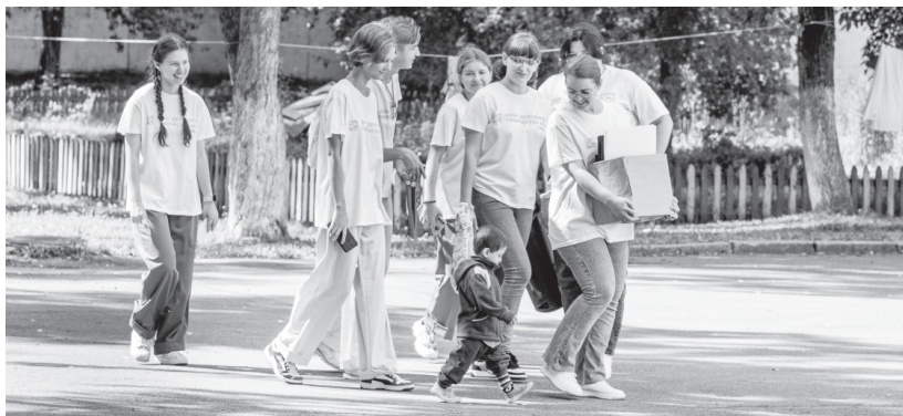
Малыши из ПВР рады волонтерам