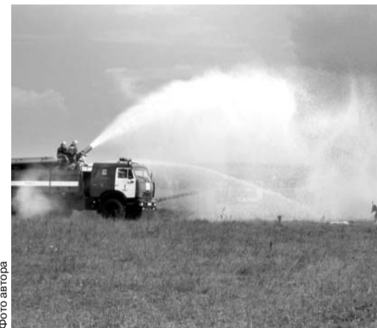
Тушение обломков «самолёта» заняло несколько минут