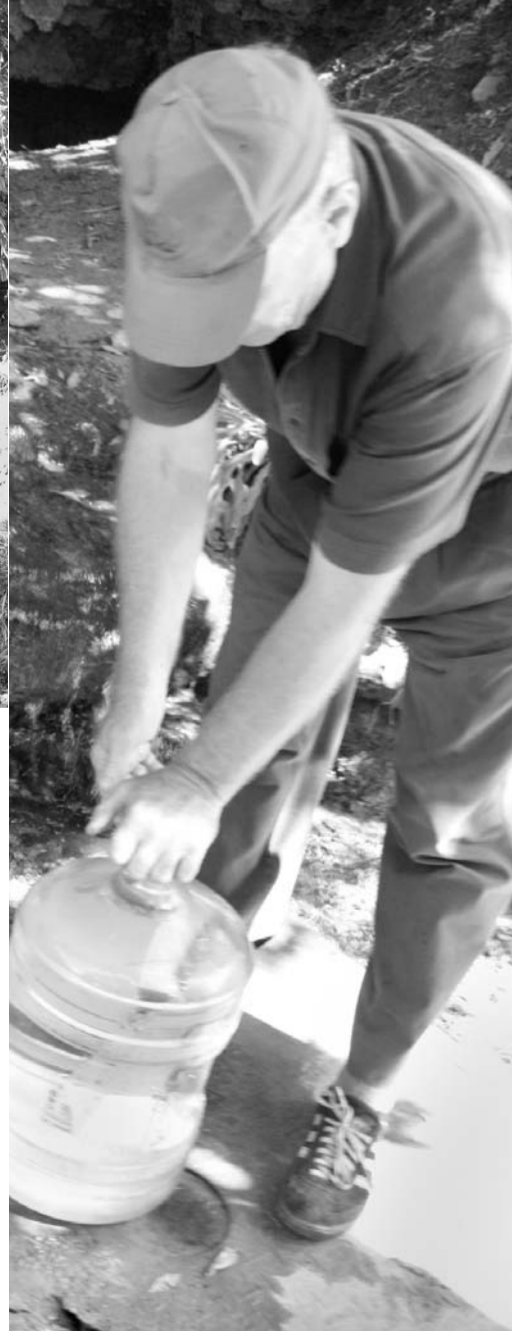
В Салтыках воду набирают канистрами