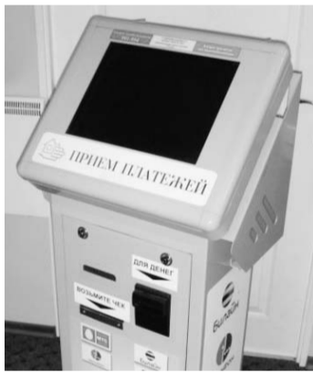
Терминал вернули на место