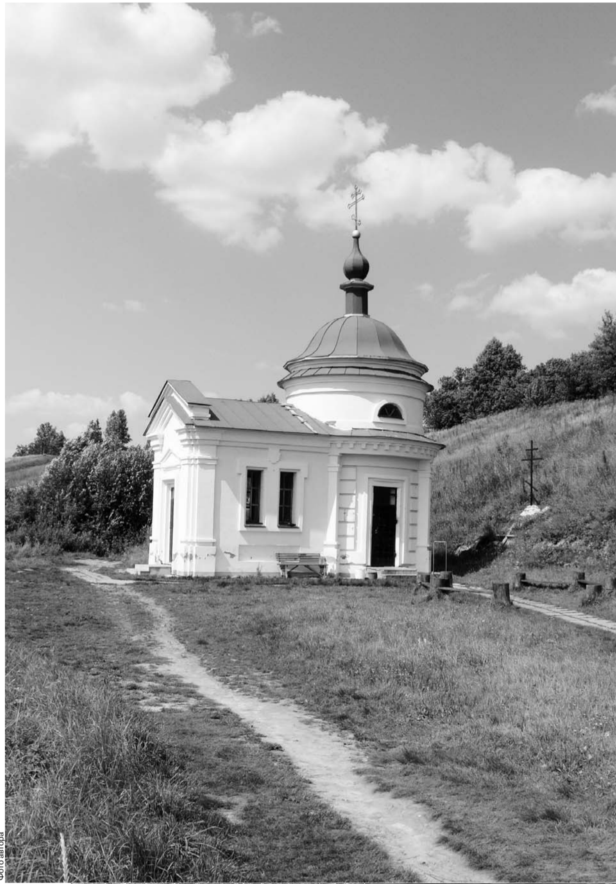
К источнику в Паслово Орловского района не зарастает народная тропа