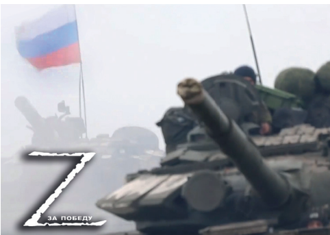
Специальная военная операция