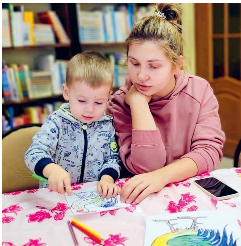
Дети всегда с удовольствием приходят в любимую Пришвинку