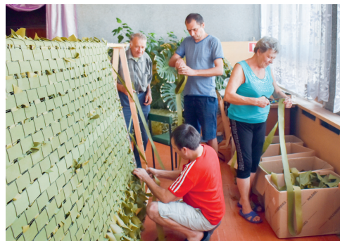
Курск, мы с тобой!