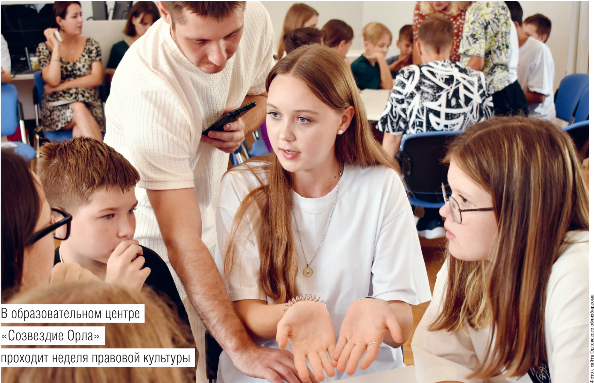
В образовательном центре «Созвездие Орла» проходит неделя правовой культуры