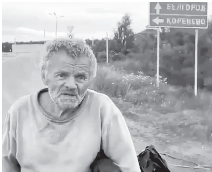
80 лет спустя на Курской земле снова «эсэсовцы» и «русский Иван»

не понимая, чего от него хотят, топчется на месте, потом нерешительно начинает двигаться по дороге прочь от этих гогочущих «фрицев». Этим и обрывается выложенное в Сети гнусное фашистское «кино».