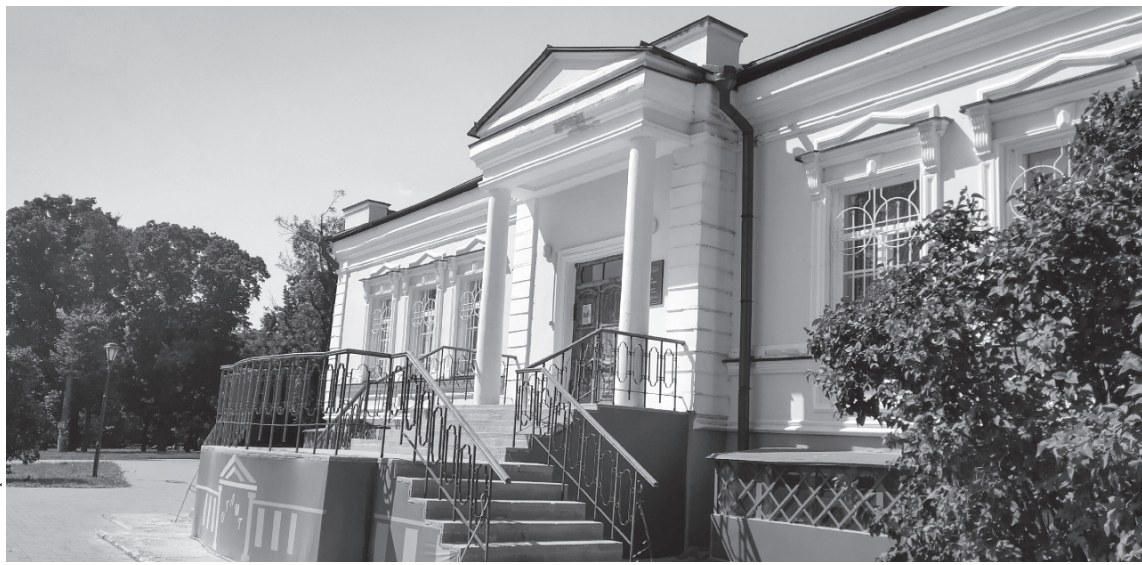
Орловский музей И. С. Тургенева — один из самых любимых орловцами и гостями города