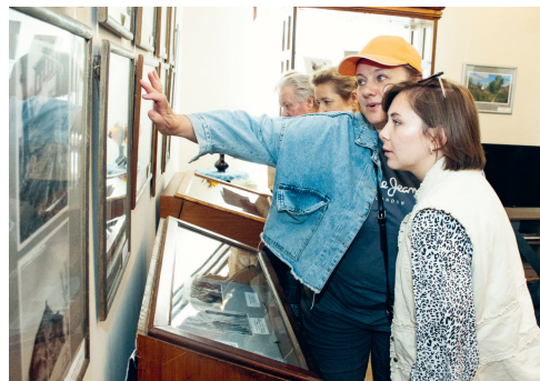
Музеи — мосты между прошлым и будущим