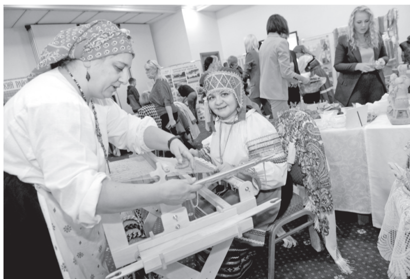
Веков связующая нить