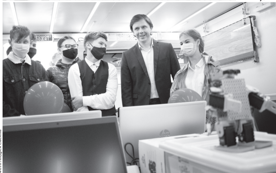
Мобильный технопарк «Кванториум» даёт шанс получить дополнительное образование детям орловской глубинки

изводств и переработки, вернуться к алгоритмам системы потребительской кооперации, заготовконтрам, кооперационным цепочкам в переработке: малым пищекомбинатам, сыроварням, хлебопекарням. Надо мобилизовать систему таргетированной господдержки фермерства, ЛПХ, МСП в сельской местности.