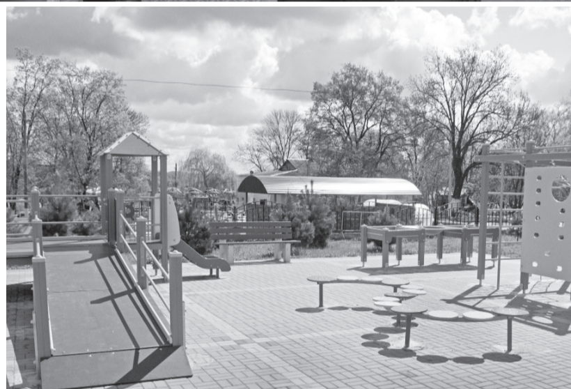
Современная игровая площадка — на радость сельской детворе