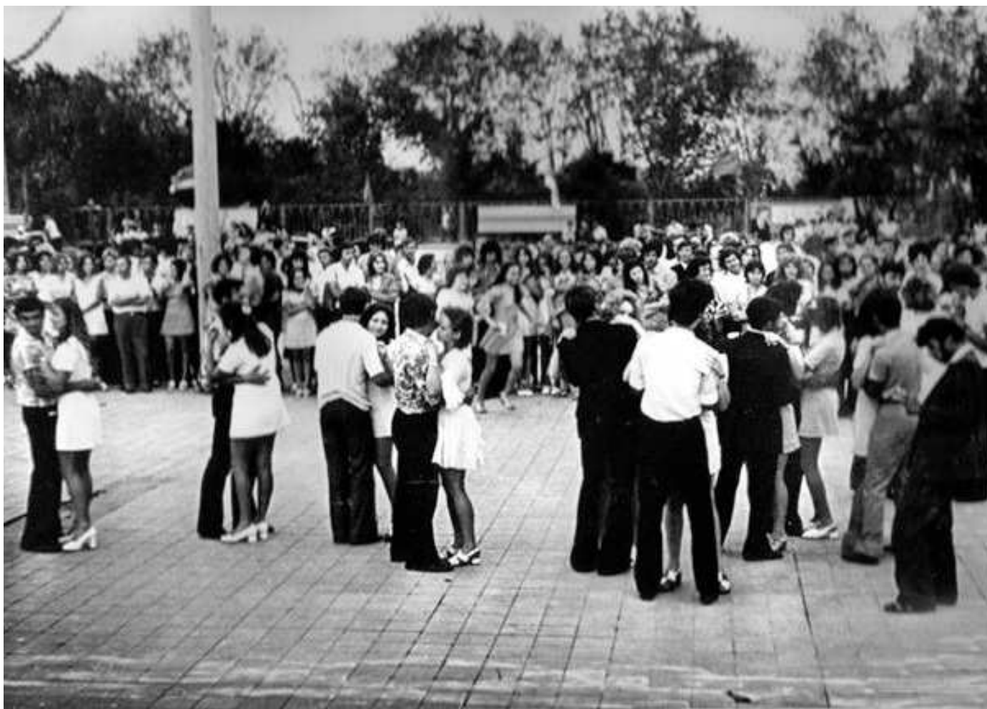
В Орловской «Клетке» был всегда аншлаг

могли не пустить в кедах, а уж тем более в джинсах, на дискотеках 80-х человек в дефицитных джинсах и кроссовках были завидным модником. Девушки тоже старались следовать моде. Невероятно модными были блестящие клепки на одежде. Делали эти украшения из битых новогодних шаров, и во время медленных танцев не лишним было предупредить кавалера о том, что он может порезаться.