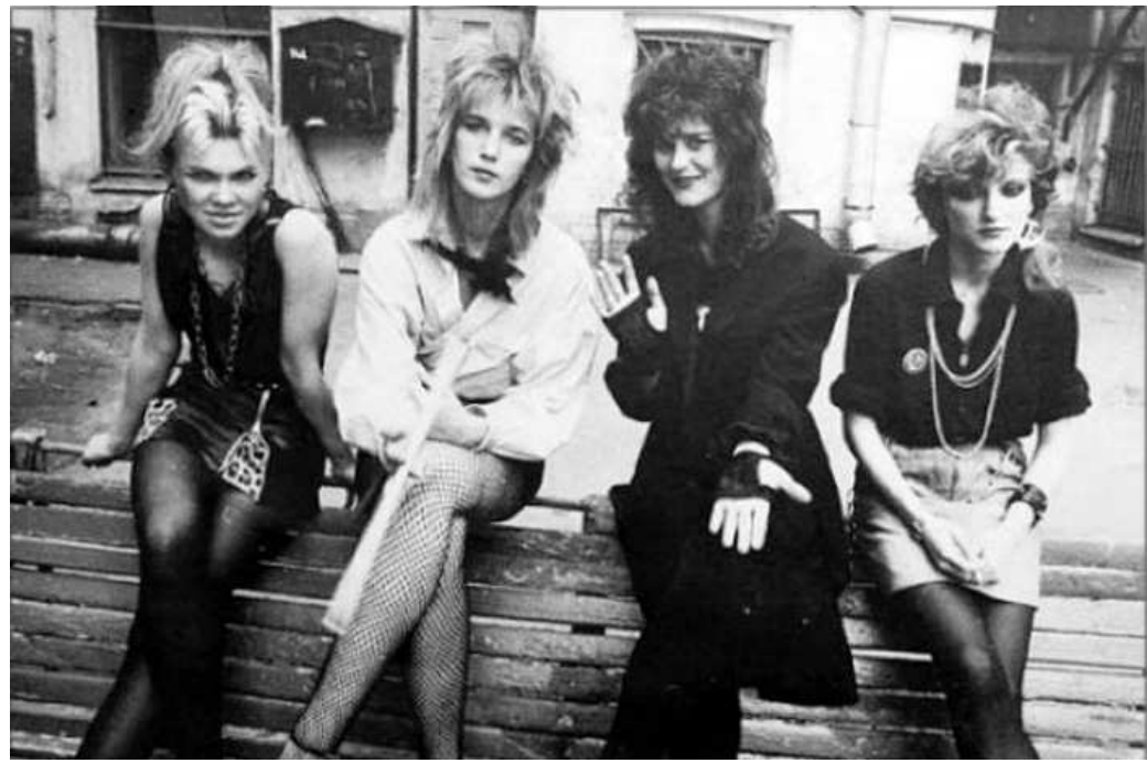
Такие девчонки вдохновили кинематографистов на создание «Маленькой Веры»

Это были последние дискотеки на кассетных носителях, дальше шла эра современной электронной музыки.