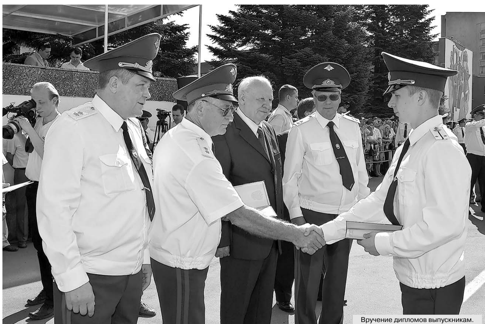
Вручение дипломов выпускникам.