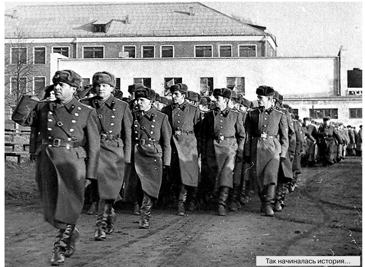
Так начиналась история...

Сохранение и развитие лучших традиций академии, внедрение инновационных педагогических технологий, широкая интеграция в образовательное пространство России — все это позволяет коллективу вуза и впредь обеспечивать благоприятные условия для обучения и воспитания новых поколений сотрудников отечественных спецслужб. Это не только итог пройденного пути, но и залог дальнейшего динамичного развития Академии ФСО России.