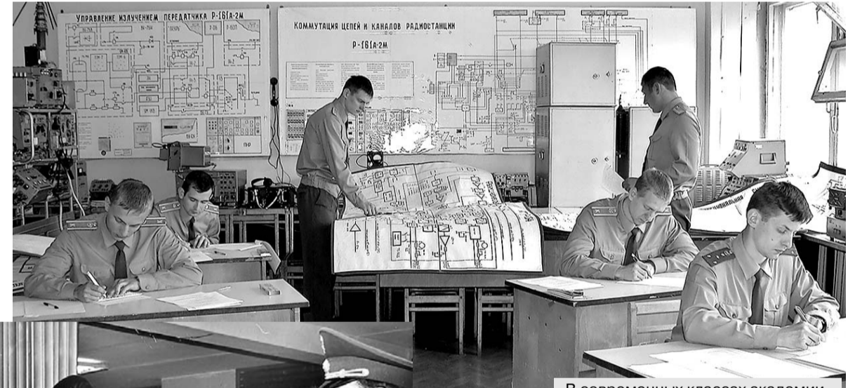
В современных классах академии.

Очередной этап реформирования военного училища завер-