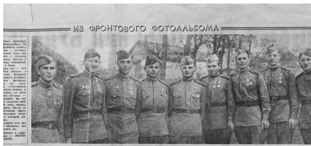
ИЗ ФРОНТОВОГО ФОТОАЛЬБОМА

В течение нескольких месяцев «Орловская правда» и Орловское областное отделение Российского творческого союза работников культуры осуществляли совместный проект «Поклон совести», посвященный 65-летию Великой Победы. На страницах газеты были опубликованы материалы о 60 ветеранах Великой Отечественной войны (к сожалению, на сегодняшний день в живых из них осталось только 14 человек) — героях Галереи славы. В различных учреждениях и организациях были организованы выставки, прошли незабываемые встречи с людьми разных поколений. Сегодня мы не просто подводим итоги совместного проекта, но и ещё раз обращаемся к истории создания уникального собрания прижизненных портретов героев Второй мировой и его поистине бесценному значению.