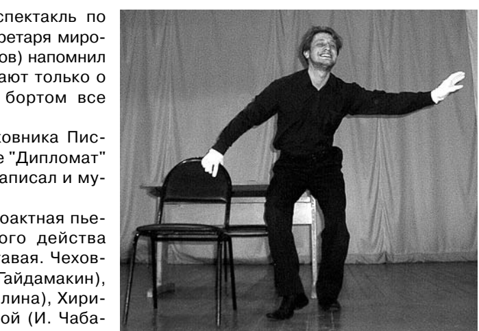
На снимках: сцены из спектакля.

Публика громкими аплодисментами не давала уйти актерам со сцены. Уже потом, в гримерке, режиссер Н.Н. Смогиль призналась, что волновалась вдвойне: спектакль премьерный, и для многих это пер-