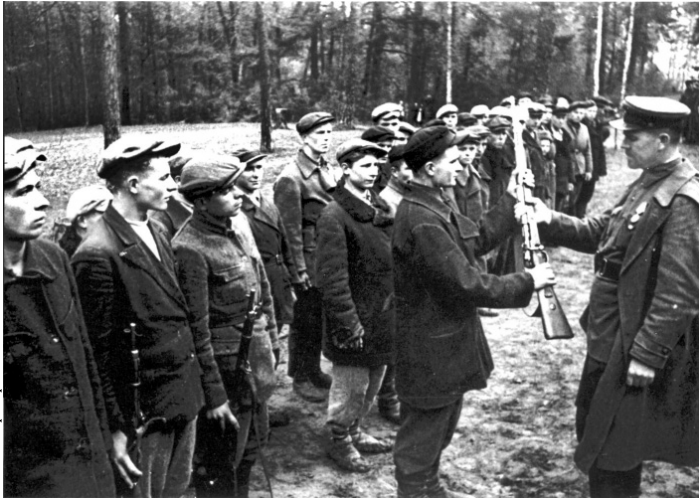
Вручение оружия новым бойцам партизанского отряда