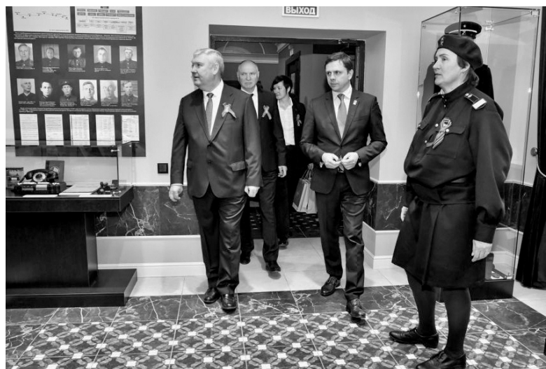
В музее — экспонаты, посвящённые истории железной дороги и Великой Отечественной войны