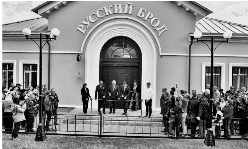
Торжественное открытие обновлённого вокзала станции Русский Брод

Ранее поезд Победы встретили жители города Орла, посёлков Залегощь и Верховье.