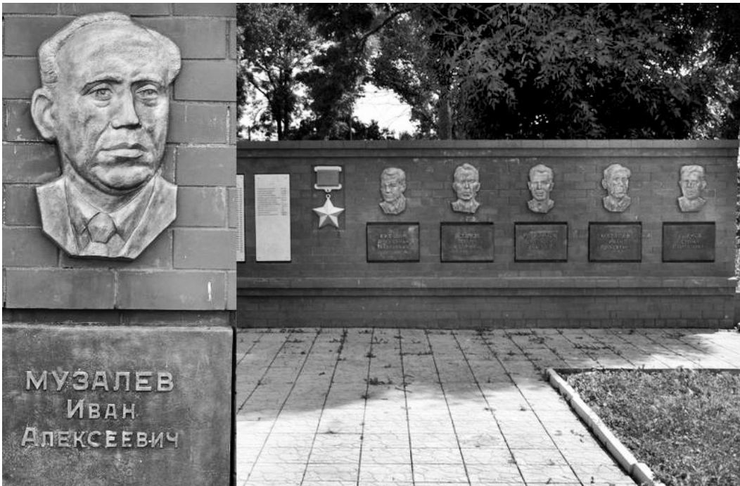
Мемориальный комплекс героям в г. Новосиле