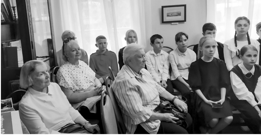
В Доме Грановского интересно всем поколениям