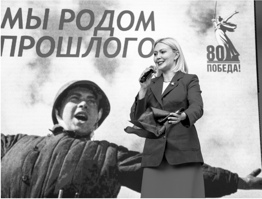
Акция «Синий платочек Победы» — это возможность прикоснуться к истории нашей страны, отдать дань памяти подвигу женщин в годы Великой Отечественной войны