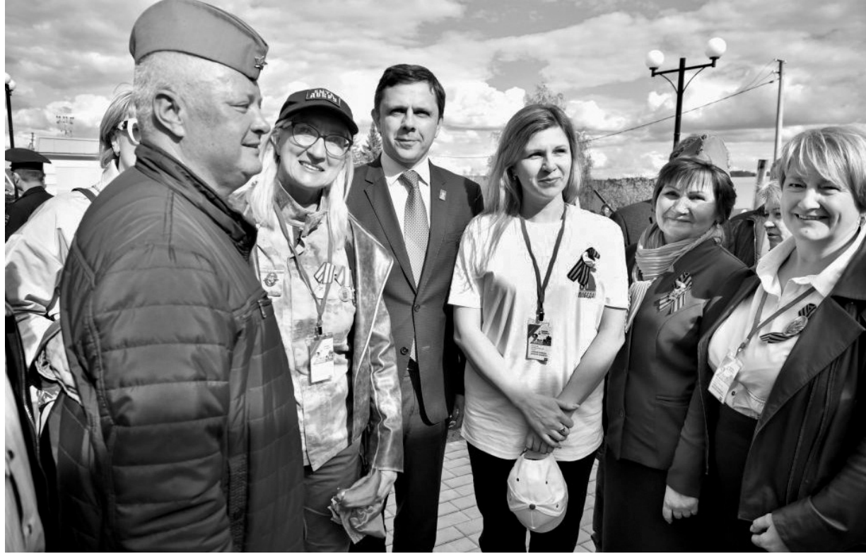
Тёплая встреча на перроне

и обновлению платформы, которая теперь отвечает всем современным требованиям