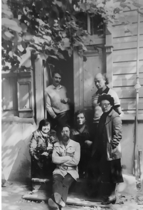
Лето 1984 г. У входа в Дом Грановского — представители орловской культуры