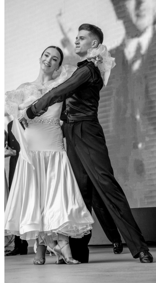
Синенький платочек падал с опущенных плеч...