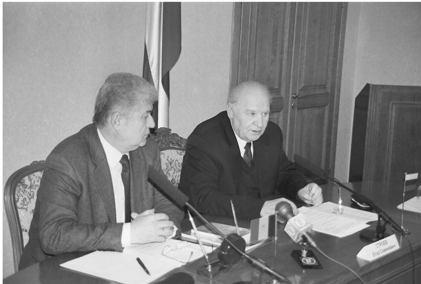
Губернатор Орловской области Е.С. Строев и президент Республики Молдова В.Н. Воронин.

Между Орловской областью и Республикой Беларусь подерживаются взаимовыгодные