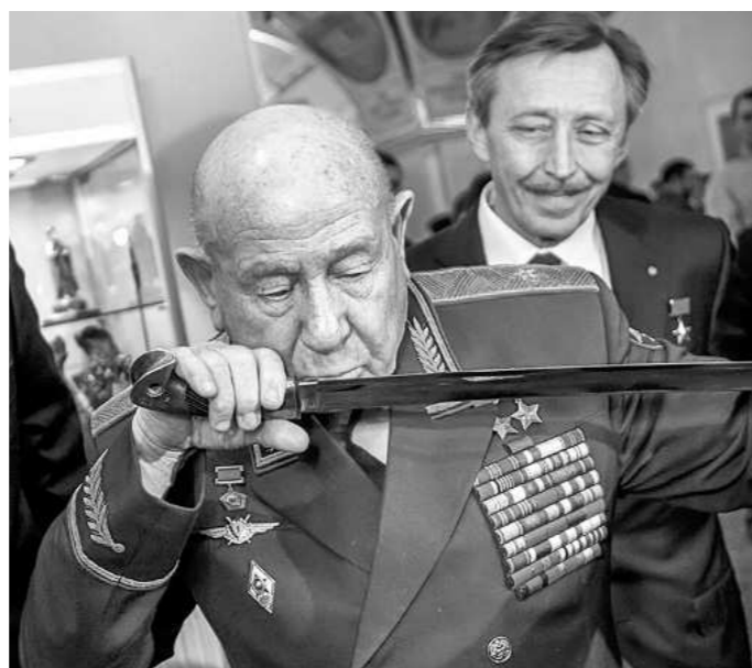
Для космонавта А. Леонова и генерала Б. Соколова шашка маршала Рокоссовского — вещь святая

прошли курс реабилитации и теперь живут обычной мирной жизнью.