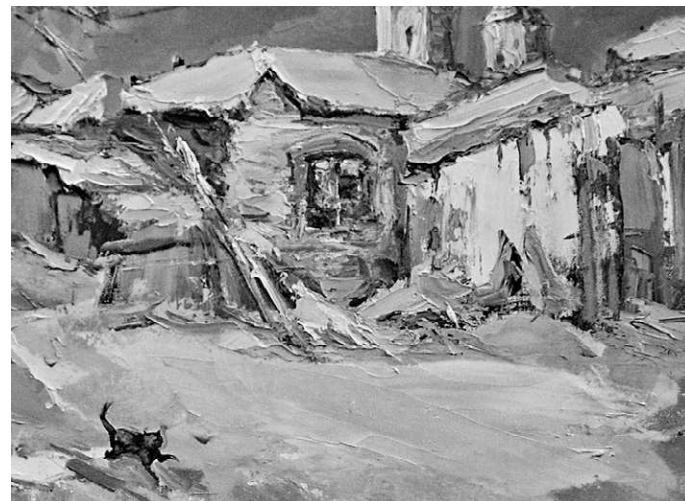
А. Костяников. «Старый двор»

— Выставка пленэра с большим успехом проходит уже многие годы. Символично, что сегодня она совпала с начавшимся Годом культуры. Пока это первая ласточка, далее мы запланировали новые интересные экспозиции орловских художников. Почитателю нашего искусства ждет насыщенный год, — рассказал председатель правления Орловского отделения Союза художников России Владимир Блинов.