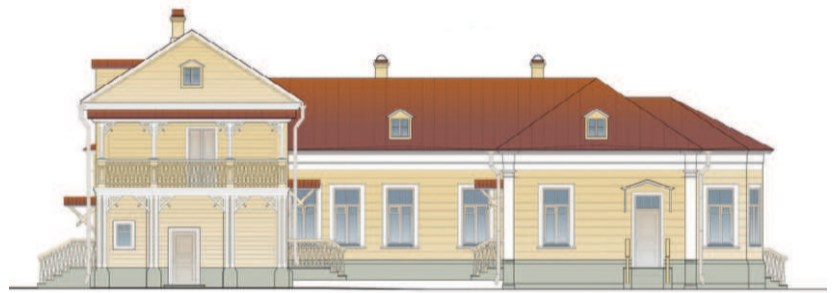
...а таким он видится автору проекта реставрации

В мае 1903 года с целью увековечения памяти о Тургеневе Орловское общество изящных искусств объявило об открытии на части этой усадьбы общественного сада «Дворянское гнездо», а в июне там был установлен первый в России памятник Тургеневу — бюст в копии работы М. Антокольского. Открытие сада и установка памятника во славу Тургенева и его романа стали значимыми явлениями общественной жизни города.