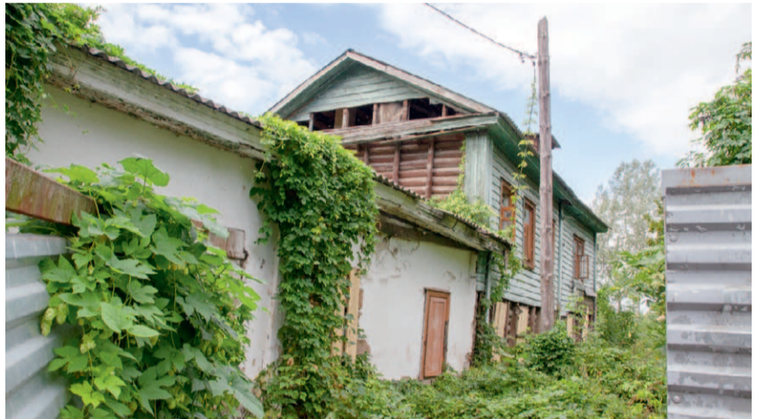
Нынешнее состояние дома Лизы Калитиной удручает...

С интересом читаются главы о героях романа — Лизе Калитиной, Лаврецком, Лемме, об их предполагаемых жителях Орла прототипах. Конечно, Тургенев мог придумать или списать образы с кого угодно, но читателям хотелось видеть живое воплощение героев романа. Орловцы гордились Тургеневым и тем, что он написал роман об их городе и живших в нём людях.