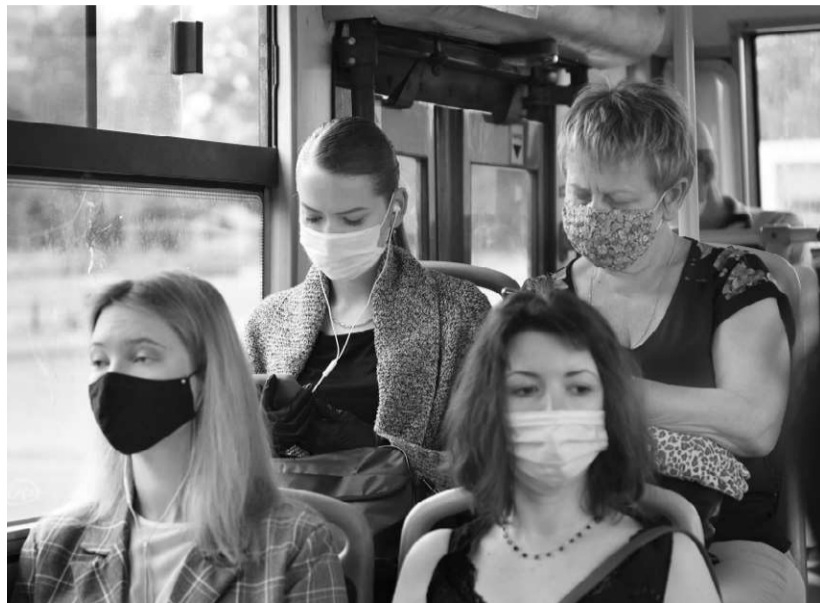
К сожалению, орловцы — пассажиры общественного транспорта — пока не могут похвалиться такой антиCOVIDной дисциплиной