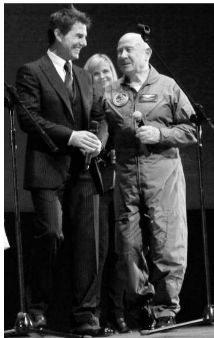
Покоритель космоса и кинозвезда с радостью пожали друг другу руки

В столичном кинотеатре «Октябрь» состоялась не только премьера фантастического триллера «Обливион». Исполнители главных ролей — Том Круз и Ольга Куриленко — встретились с легендарным космонавтом Алексеем Леоновым, который первым в истории Земли вышел в открытый космос.