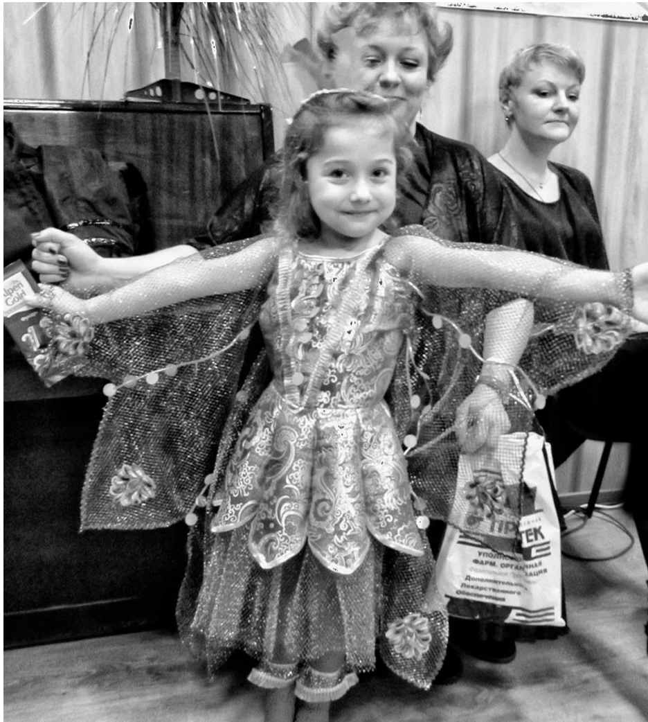
На утреннике в детском саду

— Вот пока в стране будут считать опеку,