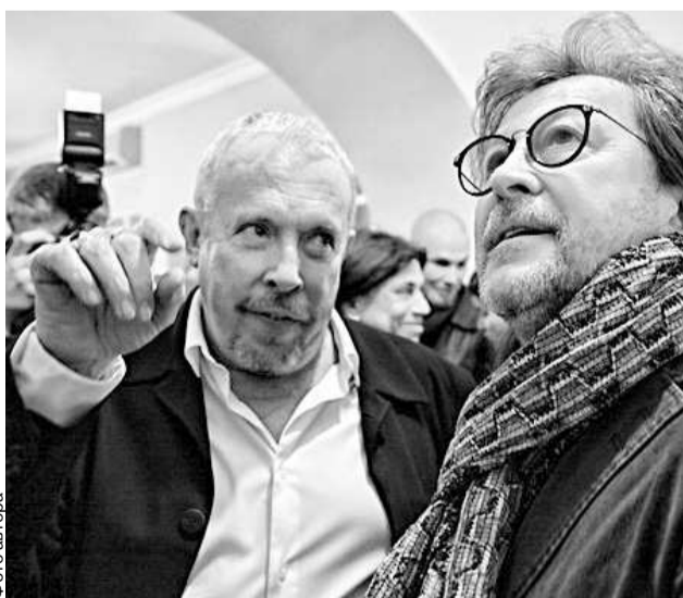
Андрей Макаревич устроил экскурсию для музыканта «Машины времени» Александра Кутикова

Выставку посетили поклонники творчества известного музыканта и художника и его друзья, в том числе известный композитор Владимир Ма-