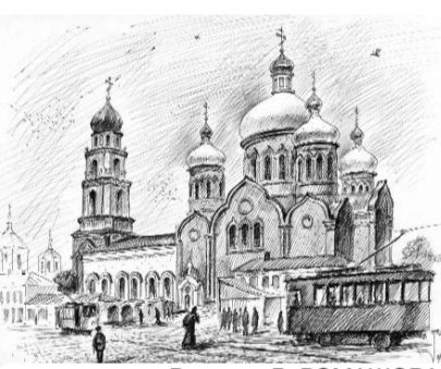
Рисунок В. РОМАШОВА.

Происхождение праздника таково. Было это в X веке, в Византии. Жители столицы империи — Константинополя — молились со слезами во Влахернской церкви на всемогущую (тогда эта служба шла, действительно, всю ночь) о защите от одолевавших врагов. Обращались они прежде всего к Богородице, так как в этом храме еще с V века хранились риза Богородицы, головной покров (мафория) и часть пояса, перенесенные из Палестины. На службе присутствовал и славянин, русский, по имени Андрей — в молодых годах он попал в плен и был продан в Константинополь в рабство.