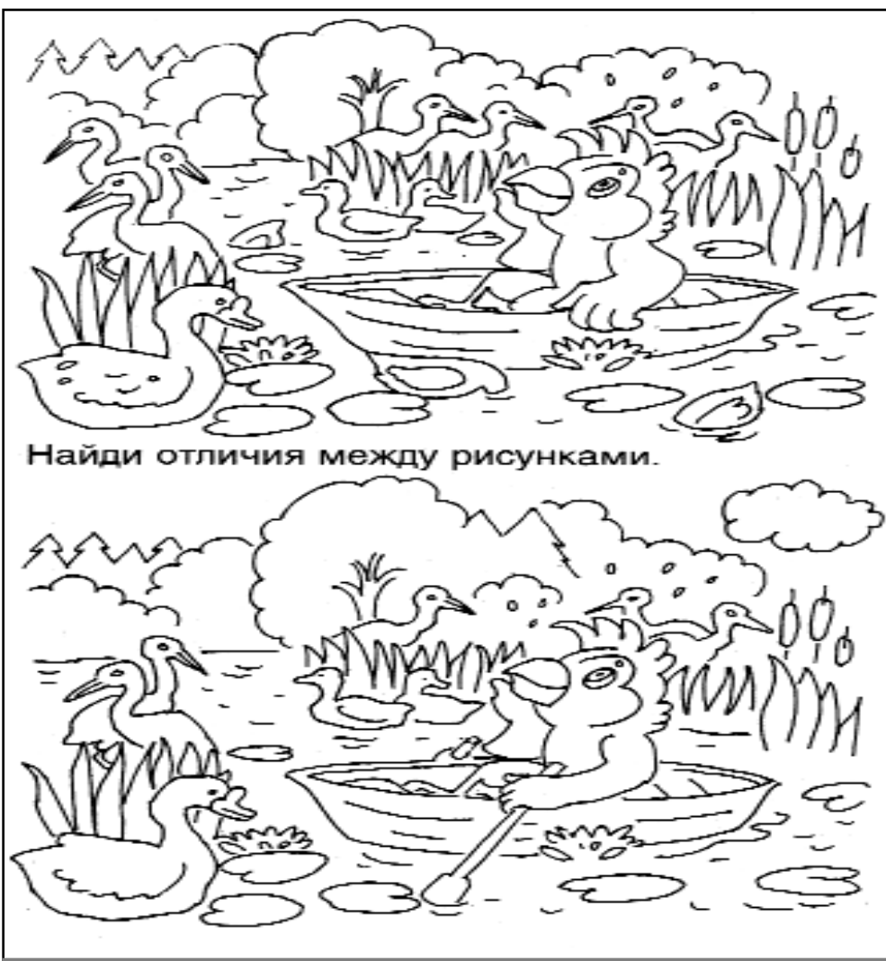
Найди отличия между рисунками.