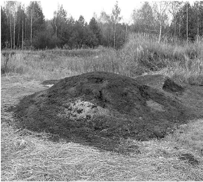
Одна из многих браконьерских приманок для кабанов.