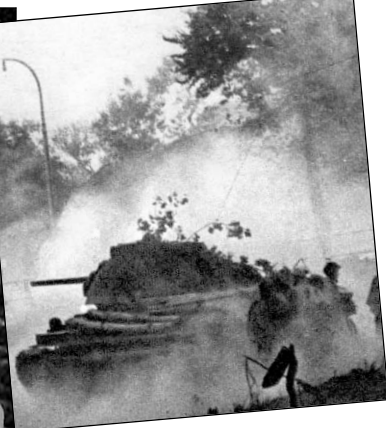
водитель развернул машину и увидел "тигра". Пушка его от удара задралась кверху. Немцы, покидая машину, разбежались в разные стороны...

Вскоре село взяли. После боя долго смеялись, вспоминая, как столкнулись с "фрицем".