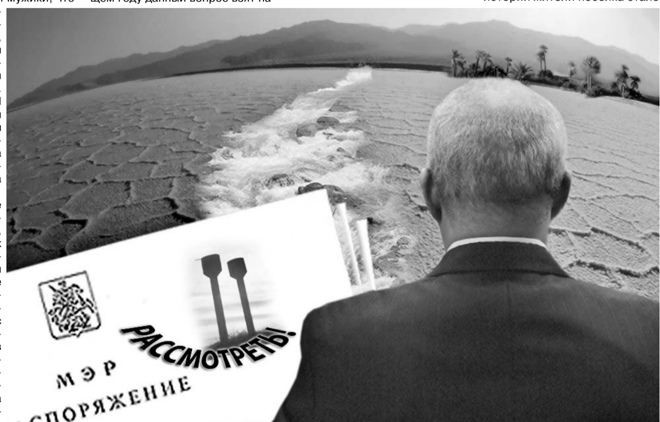
Коллаж Сергея МИРОНОВА

На днях в актовом зале территориального управления Роспотребнадзора по Орловской области прошла встреча за "круглым столом". Обсуждалась тема взаимодействия контролирующих органов и малого бизнеса. В работе принимали участие представители исполнительной власти, контролирурующие органы, предприниматели области.