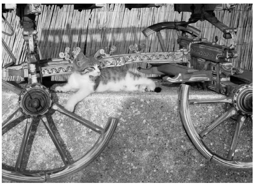
Фото К. Гладышевой, г. Орел.

Наш адрес: 302000, г. Орел, ул. Брестская, 6, к. 33.