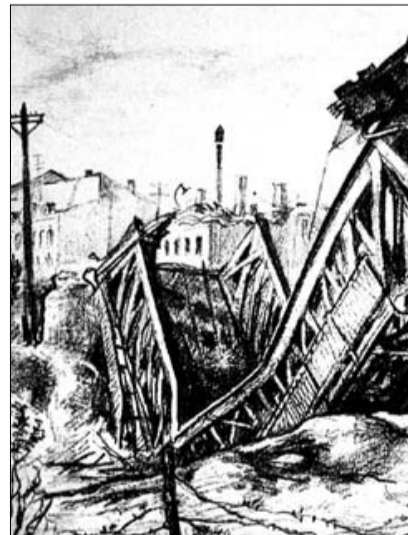
Разрушенный Орёл в годы войны.

Галия пожалела племянников: — Да уже привычки.