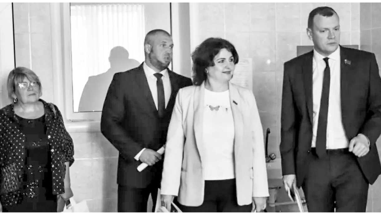
Депутаты ознакомились с работой Болховской центральной районной больницы