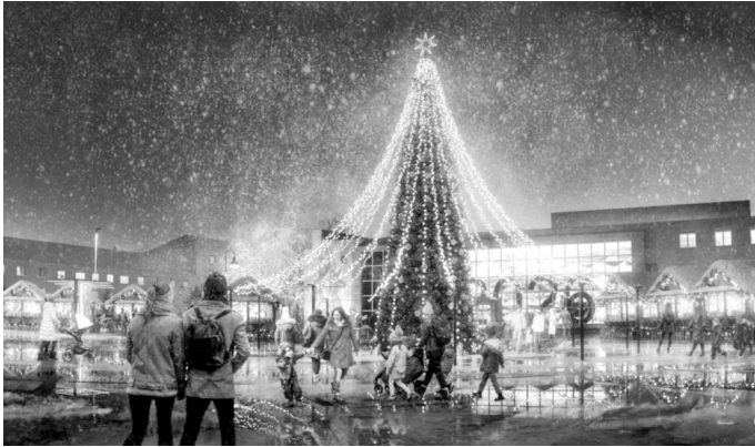
«Тургеневская площадь» во Мценске