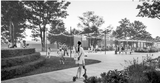
«Охотников привал» в посёлке Колпна