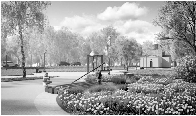
«К истокам» в селе Кривцова-Плота Должанского района