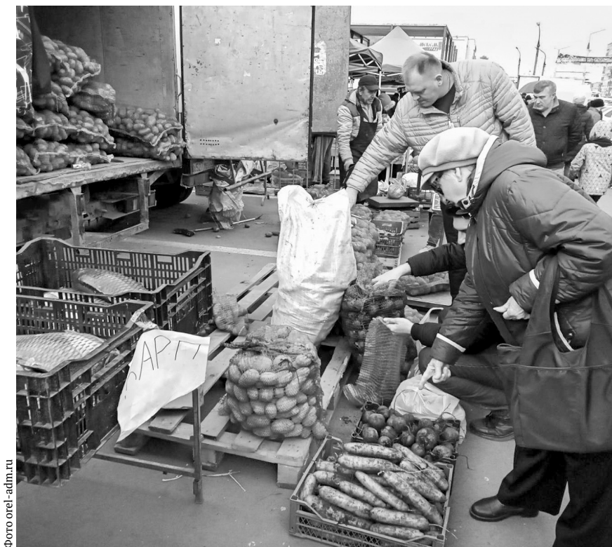
Ярмарки выходного дня привлекают орловцев богатым ассортиментом товаров и их доступностью