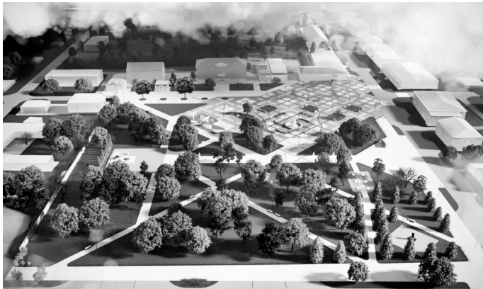
«Парк Победы» в городе Малоархангельске