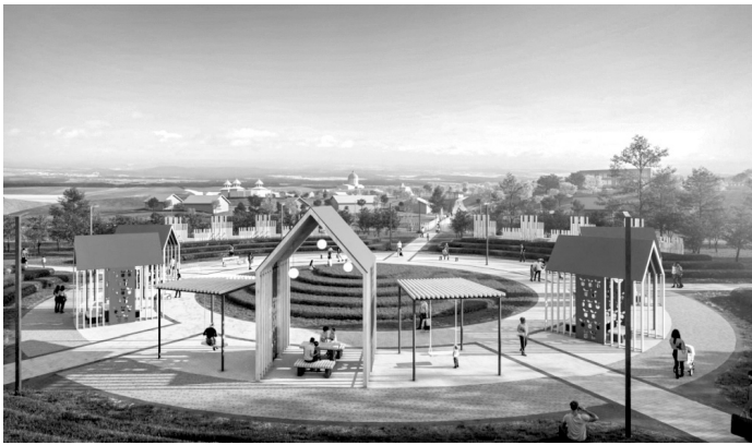
«Лесков Посад» в посёлке Кромь