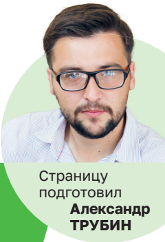
Страницу подготовил Александр ТРУБИН