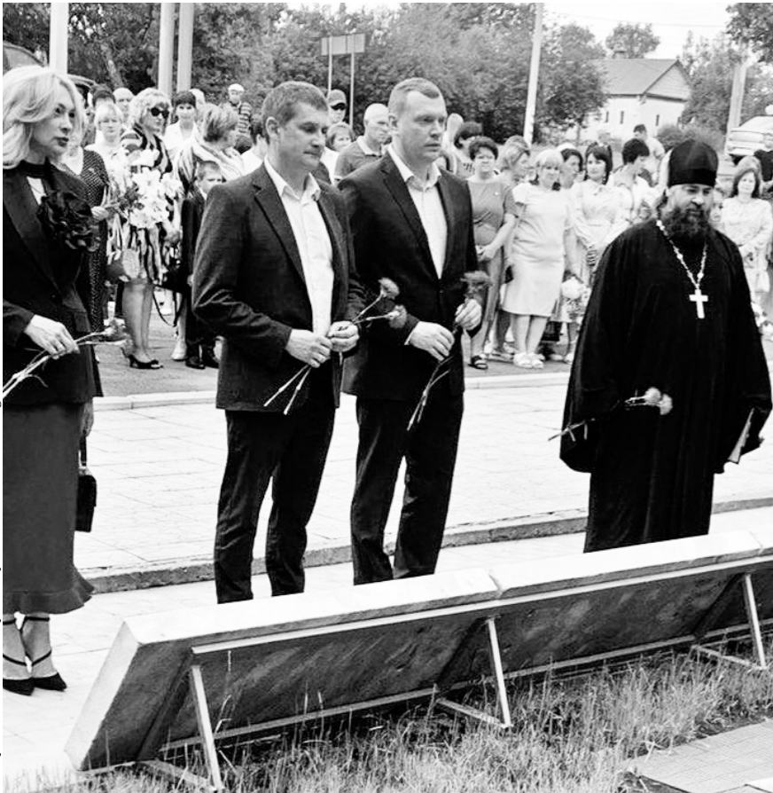
Память павших воинов почтили минутой молчания

На прошлой неделе три района Орловщины отметили годовщину образования