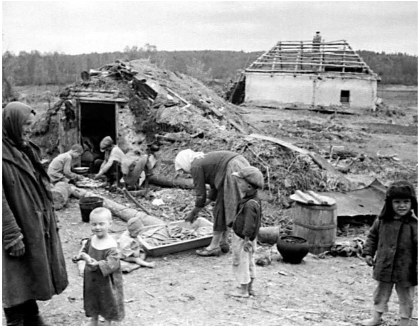
Спасибо вам, милые вдовы, что вы не забыли любимых, что взяли мужские заботы, детей воспитали родимых

В годы оккупации, да и какое-то время после неё, семья жила впроголодь. Летом были ши из лугового шавеля и крапивы, борщ из листьев красной свёклы, которую так обрывали, чтобы оставить только главный лист для продолжения роста. Зимой — картошка да мочёные овощи и главное блюдо — окрошка из фасоли на огуречном рассоле.