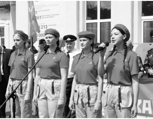
Бессмертный подвиг советского народа — в сердцах потомков

— 82 года назад жестокий и коварный враг был изгнан с Глазуновской земли. Годы всё дальше и дальше отдаляют нас от тех драматических